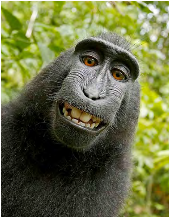
[IMAGEN 2] Caesar gritando No en un acto de rebeldía. Imagen promocional del filme Rise of the Planet of the Apes (2011, Rupert Wyatt). Twentieth Century Fox Film Corporation.

mate quien tomó la imagen. Durante un viaje a Indonesia, Slater es abordado por una manada de estos macacos que, curiosos por la cantidad de objetos nuevos en el entorno, se