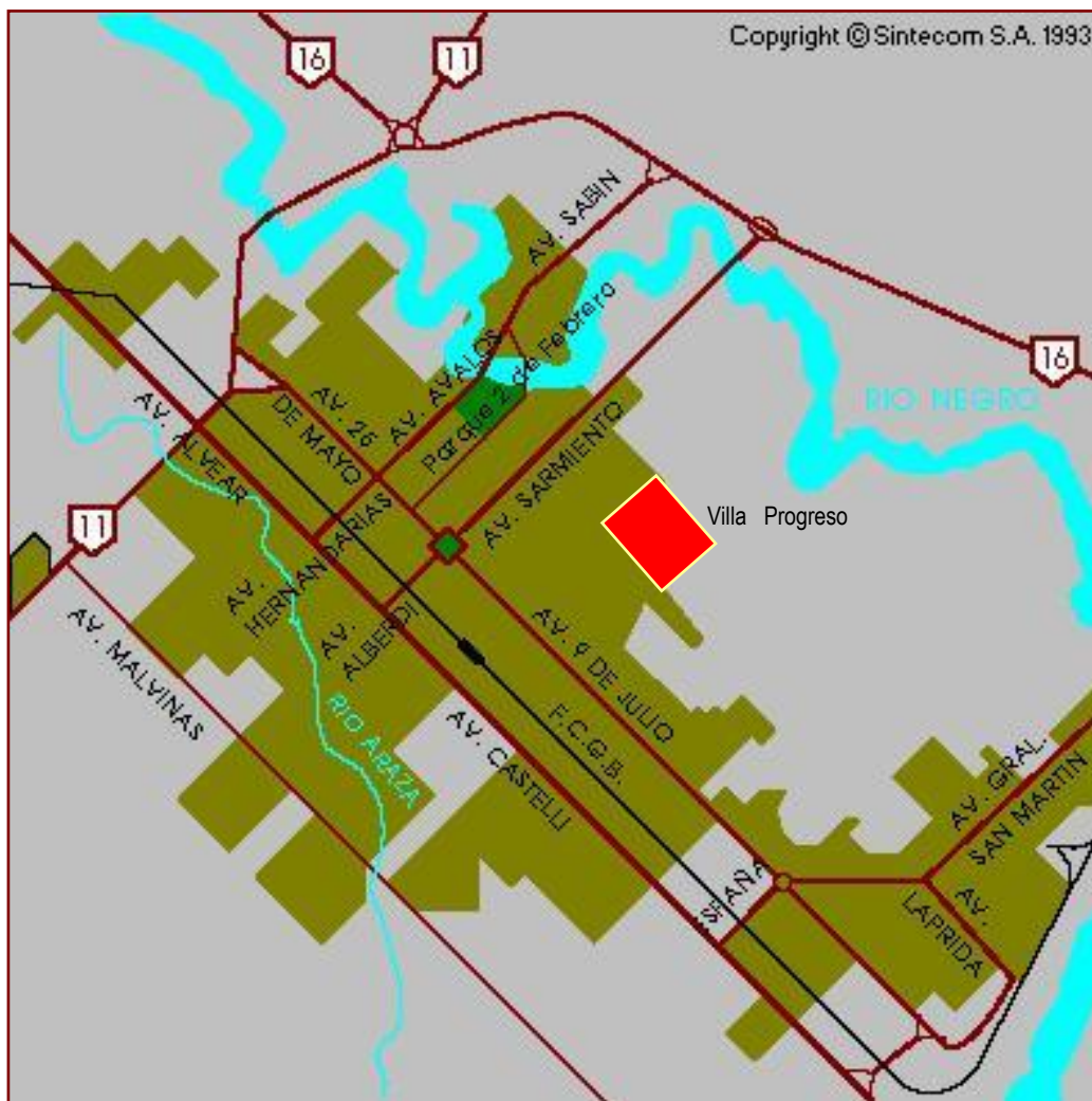
Mapa nº 2 – Resistencia y ubicación de Villa Progreso