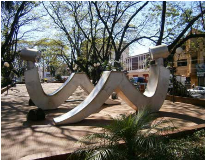
2 Monumento a la Equidad, G. Bárbaro, Plazoleta homónima, Oberá.

Alejados de la intención conmemorativa, los artistas buscaron generar una nueva relación entre obra-entorno, dando lugar al surgimiento de los parques de esculturas o museos a cielo abierto. Estas manifestaciones de carácter geométrico, minimalista y en algunos casos cinético, exacerbaban el efecto etéreo y ambiguo de su superficie que refleja el paisaje circundante. Un ejemplo en Oberá es el Monumento a la Equidad, en homenaje al día Internacional de la Mujer, obra de Graciela Bárbaro. La misma fue realizada en láminas de acero inoxidable y espejos, instalándose en la Plazoleta de los Extranjeros en Marzo de 2007.