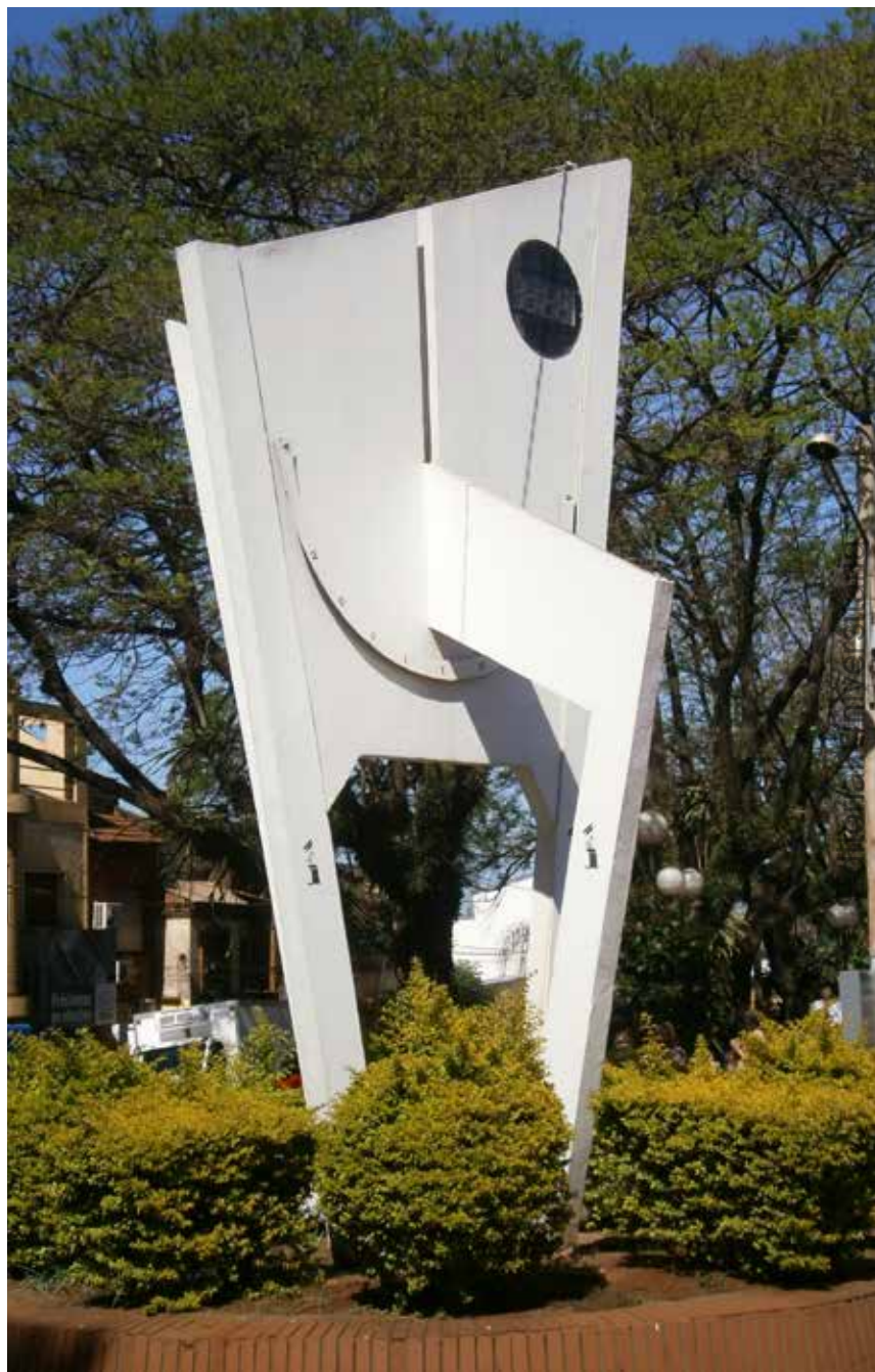
39 Reloj de Sol, Avda Sarmiento y Santa Fe, Oberá.