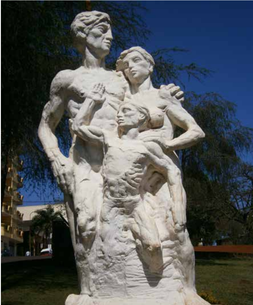
16 Familia Sueca, Abelardo Ferreyra, Plazoleta Suecia, Oberá.