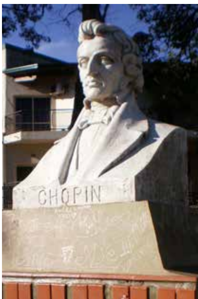
21 Federico Chopin, Ferrari, Plazoleta Polonia, Oberá.