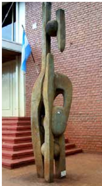
38 Esferas en tensión, Pedro A. Babenco, Avda. Sarmiento y Ctes., Oberá.