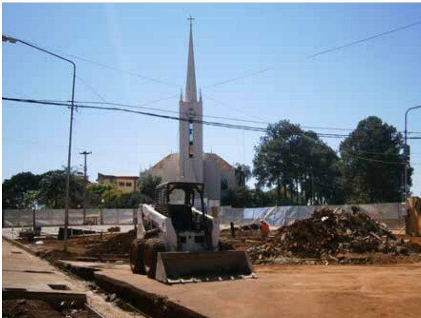
55 Estado de la obra en Marzo de 2014.