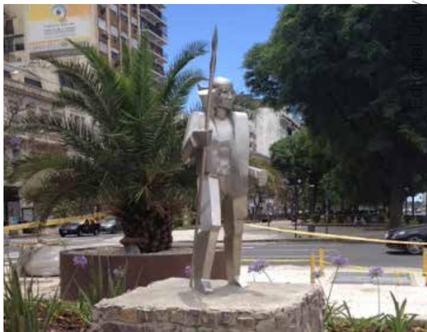
68 Réplica del Monumento a A. Guacurarí, emplazado en la Plazoleta Misiones, Ciudad Autónoma de Buenos Aires.