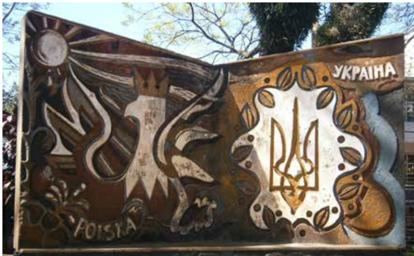
42 Monumento a la inmigración Polaco-Ucraniana, Datschke-Stragevich, dirigidos por S. Jordán, Plazoleta de los Extranjeros, Oberá.