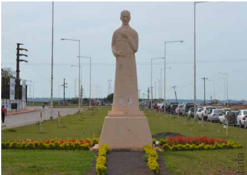
29 Monumento a S. R. González de Santa Cruz, Juan Pernigotti, Acceso al Puente Internacional homónimo, Posadas.