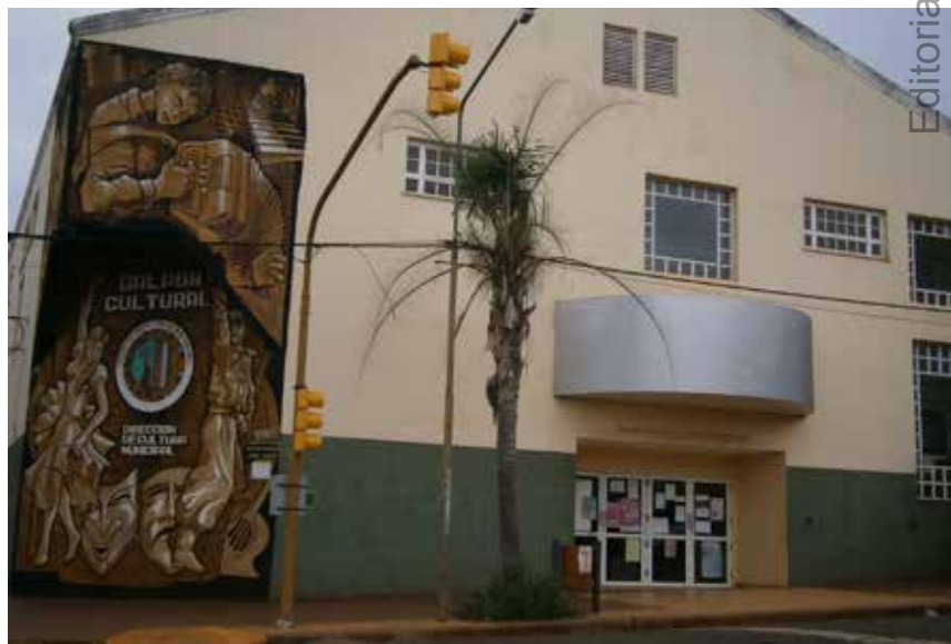
13 Casa de la Historia y la Cultura del Bicentenario. Ciudad de Oberá.

La Casa de la Historia y la Cultura del Bicentenario, se ubicó en Posadas en el barrio Itaembé Miní, a poco más de diez kilómetros del centro de la ciudad. En cambio en Oberá la Municipalidad decidió destinar para ello el Galpón Cultural, ubicado en el centro, esquina de avenida José Ingenieros y Larrea. Corresponde señalar que la edificación data de la década de 1940, fue construida por la Compañía Introdutora de Tabaco Buenos Aires para acopiar la producción de los colonos tabacaleros y constituía parte del patrimonio histórico de los obereños.