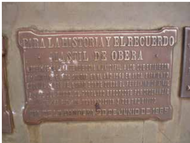
52 Para la Historia y el Recuerdo. Mástil de Oberá. Día de la Bandera, 20 de Junio de 1965.