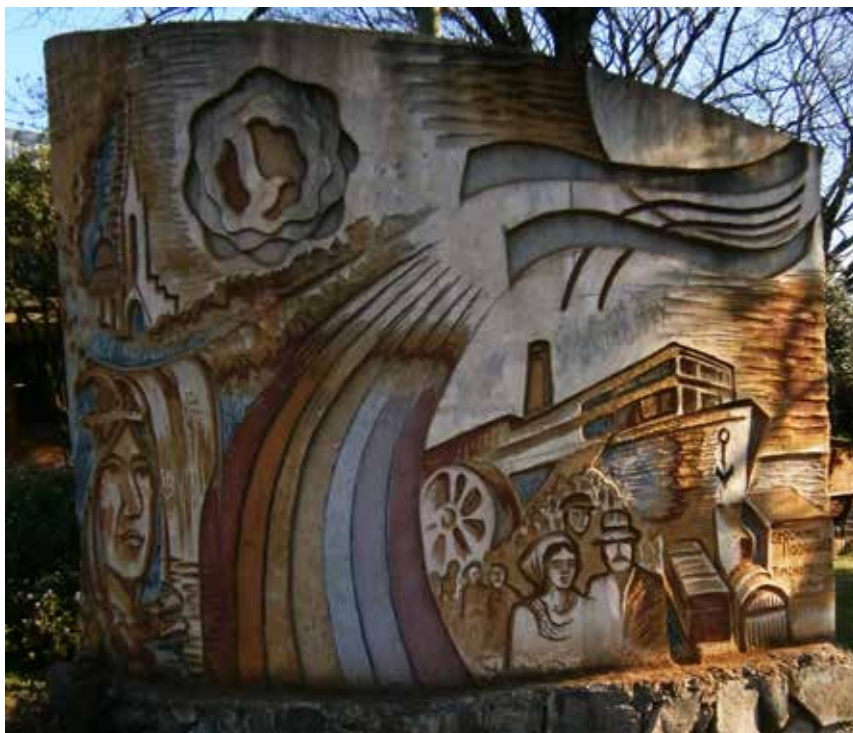
43 Mural de la Esperanza del Bicentenario, Rodriguez-Medina, Oberá.