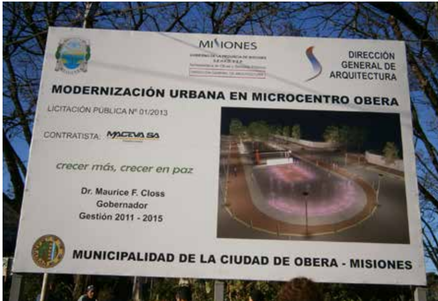
54 Cartel de Obra, donde se muestra el boceto de “Modernización Urbana en Microcentro Obra”.