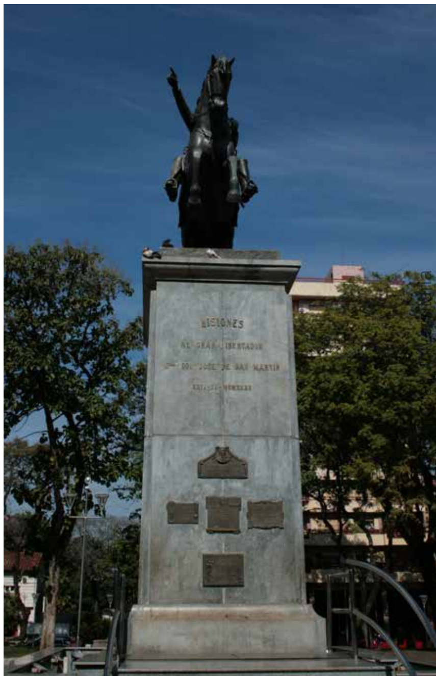
1 Monumento ecuestre a San Martín, Plaza homónima, Posadas.