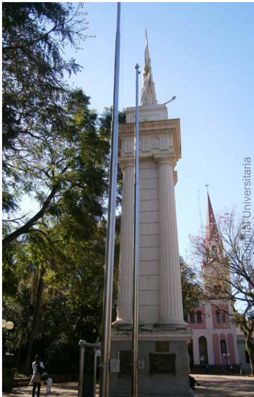
9 Mástiles interfiriendo la visión del monumento.