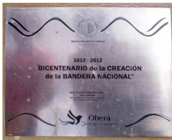
53 Placa de acero inoxidable con la inscripción "1812 - 2012. Bicentenario de la creación de la Bandera Nacional". Incluye el nombre del Intendente y cierra con el slogan "Juntos seguimos creciendo..."