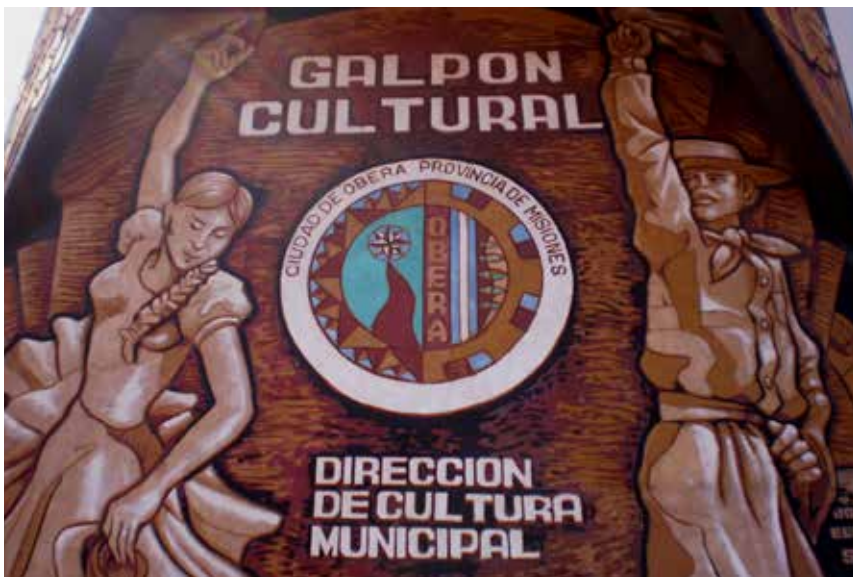
15 Detalle del mural esgrafiado, obra de Jorge Aguirre - Elena Monzón, Septiembre de 2003, Oberá.