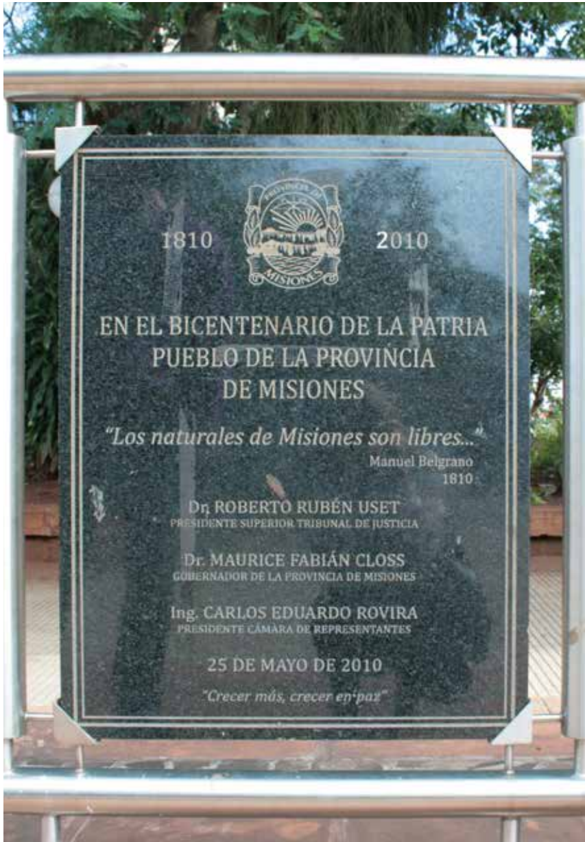
10 Placa de granito negro con marco soporte en acero inoxidable, "1810-2010. En el Bicentenario de la Patria, Pueblo de la Provincia de Misiones". Se destaca el espacio destinado a los nombres de las autoridades gubernamentales que cierra con el slogan "Crecer mas, Crecer en paz"