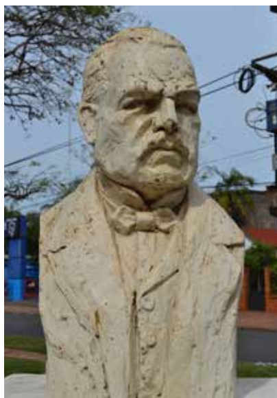
27 Busto en Homenaje a Hipólito Yrigoyen. Avenida Corrientes entre Córdoba y Bolívar. Posadas.