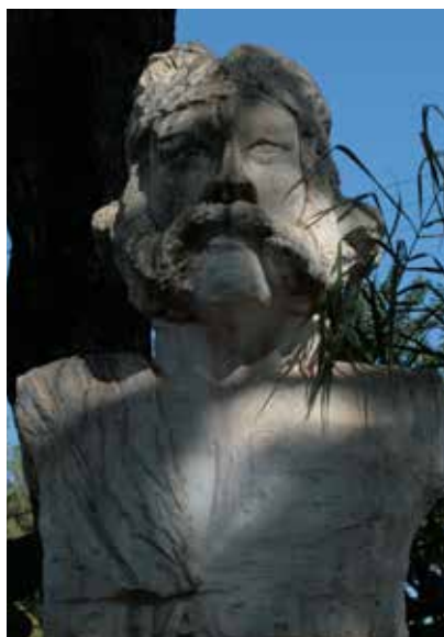
28 Busto en Homenaje a Chacho Peñaloza, Sánchez, Av. R. S. Peña, Posadas.