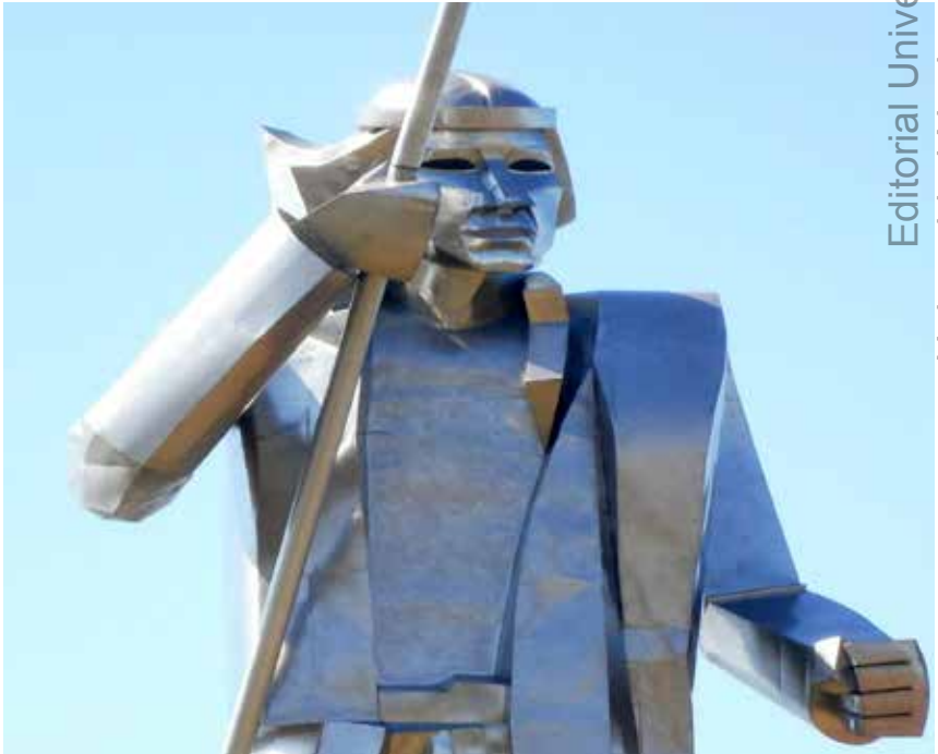
5 “Andresito Guacurari”, Avda. Costanera, Posadas.