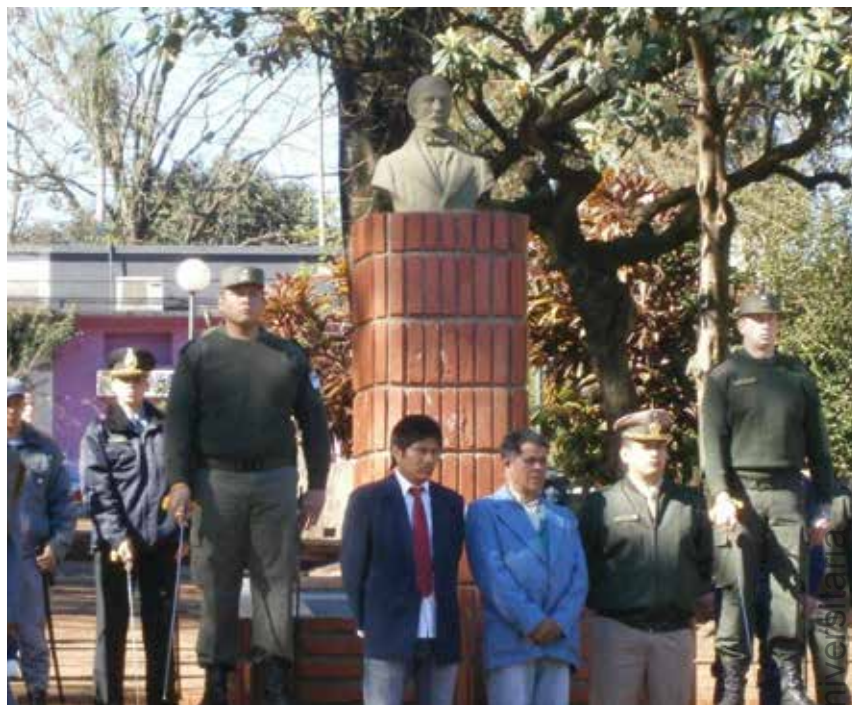
56 Acto de celebración del Nacimiento de José de San Martín, Plaza homónima de la Ciudad de Oberá, 25 de Febrero de 2014.