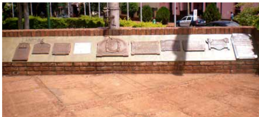
49 Detalle de placas, como se veía hasta fines de Julio 2013, Oberá.