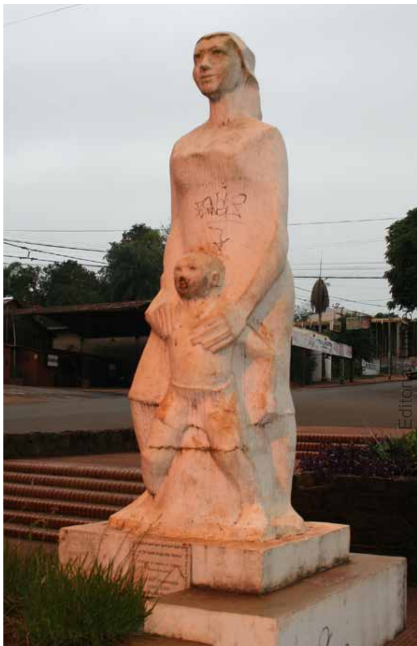
17 Monumento a la Madre, A. Gastaldo, Av. Sarmiento y Catamarca, Oberá.