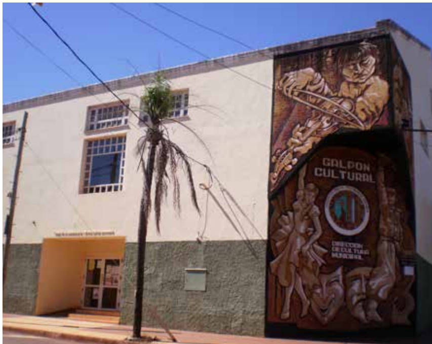
14 Vista lateral del ex Galpón Cultural, acceso por calle Larrea.