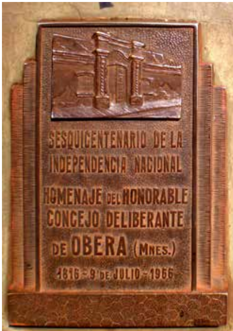
51 Sesquicentenario de la Independencia Nacional. Homenaje del Honorable Concejo Deliberante de Oberá. 1816 - 9 de Julio - 1966.