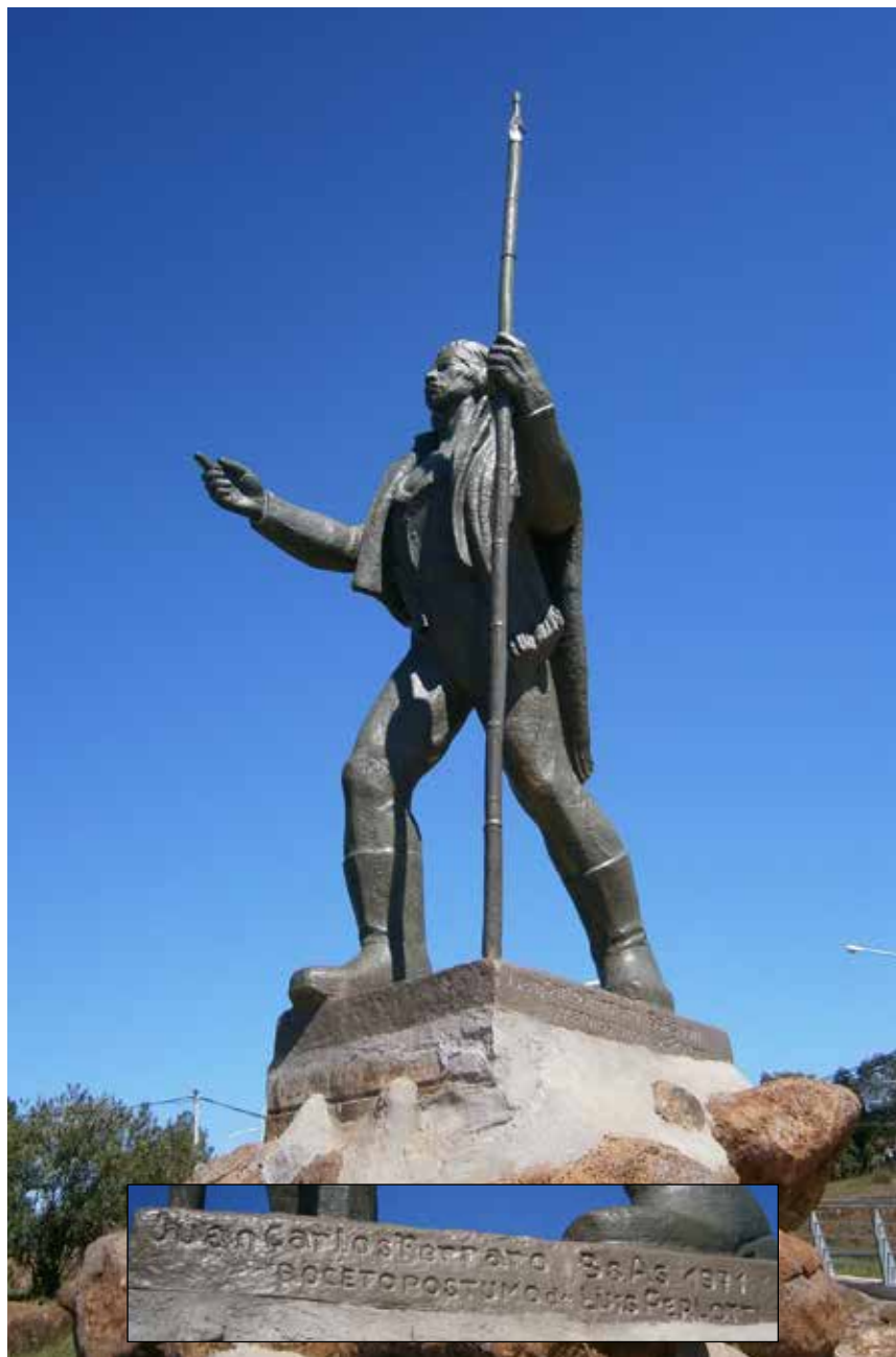
66 Monumento a A. Guacurará, realizado en bronce por Juan Carlos Ferraro sobre un boceto póstumo de Luis Perloti -1971- y detalle de su base, situado en el acceso al Municipio de Garupá y Ruta 12.