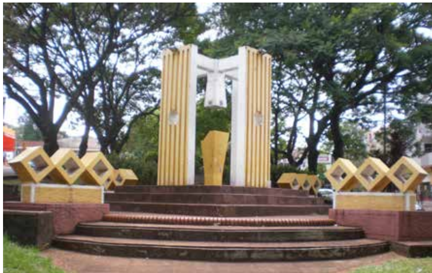
36 Monumento a La Biblia, C. Martínez, Av. Sarmiento y Catamarca, Oberá.