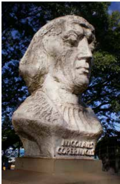
18 Nicolás Copérnico, Plazoleta Polonia, Oberá.