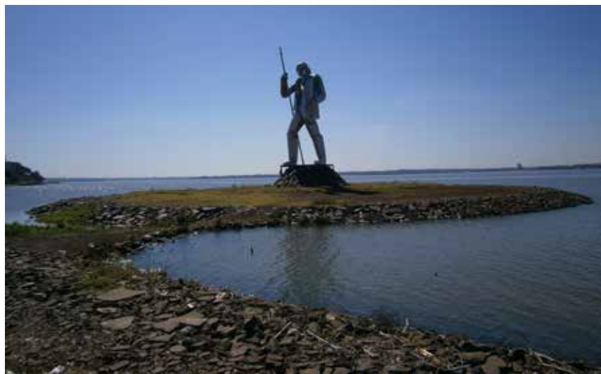
67 Vista Panorámica del monumento a A. Guacurarí, realizado en acero inoxidable por Gerónimo Rodríguez, situado en la costanera de la Ciudad de Posadas.