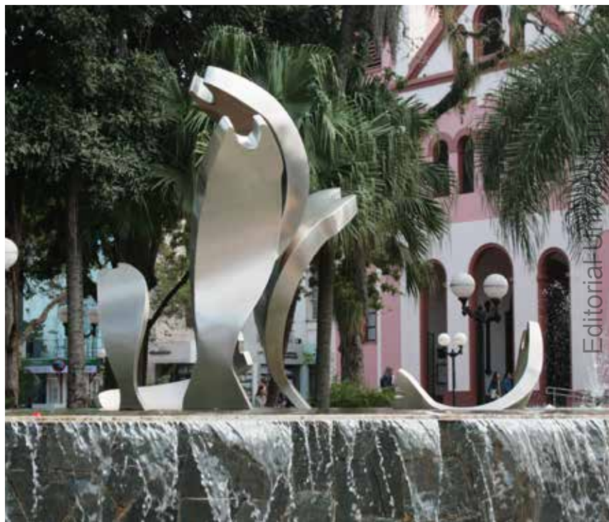
3 “Dorados”, Eduardo Ledantes, Plaza 9 de Julio, Posadas.

En la ciudad de Posadas registramos tres producciones con este material. Una está situada en la Plaza 9 de Julio en el marco de las últimas obras de remodelación de ese lugar. Su autor fue Eduardo Ledantes 5 , quien construyó un grupo escultórico de peces sobre una fuente de aguas danzantes. Los peces fueron montados de modo que algunos aparecen parcialmente sumergidos y otros se disponen a ras del agua. La iluminación nocturna mediante reflectores sumergibles de luces led, que alternan diferentes colores, completan la composición.