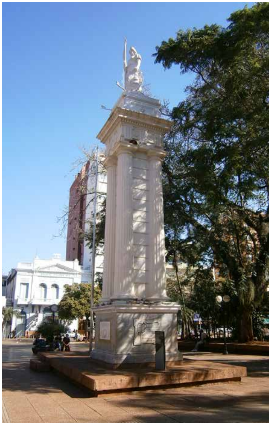
8 Monumento a la Libertad, Berthelemé, Plaza 9 de Julio, Posadas.