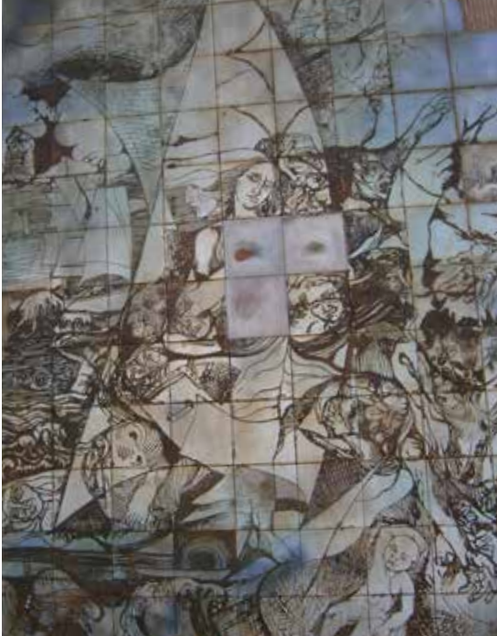
40 Mural Los Inmigrantes, Alberto Musso, Plazoleta de los Extranjeros, Oberá.

Los murales y relieves constituyen otra de las manifestaciones que operan como lugares de memoria . Se trata de creaciones de formas tridimensionales ajustadas a la superficie de un plano. En éstos las convexidades y concavidades han sido estructuradas con una materia que tiene un volumen, una densidad, un peso. Visto desde este ángulo, el relieve tiene puntos de contacto con la escultura de bulto, la diferencia consiste en que –en general- sus dimensiones se reducen a altura y ancho en el bajo relieve; en este sentido estaría más cerca de ser considerada una obra cuasi bidimensional. La lectura de obra, está regida por los mismos principios que para la escultura. En el caso de Oberá, el mural Los Inmigrantes de Alberto Musso, prácticamente no presenta variación de profundidad, en tanto Niños y Pájaros realizado por el mismo autor con sus alumnos evidencia un relieve mayor. (Jordán, 2012).