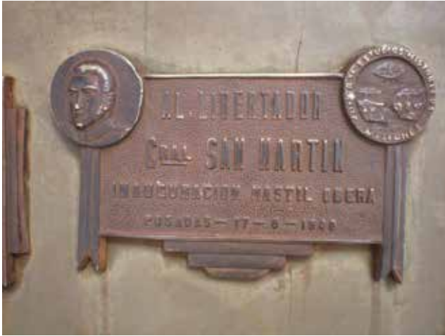
50 Al Libertador General San Martín. Inauguración Mástil Oberá, Posadas 17 - 8 - 1940. Junta de Estudios Históricos de Misiones.