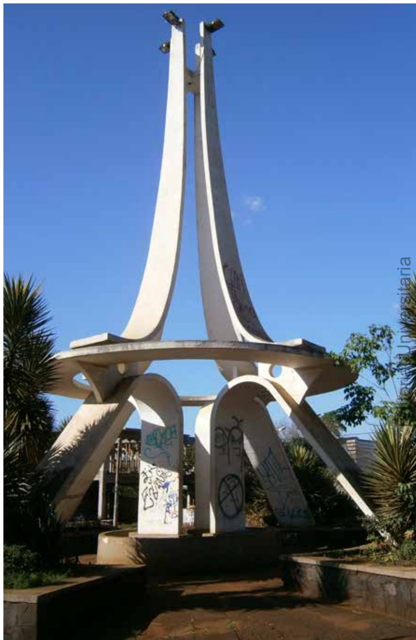
35 Monumento al Cincuentenario, Arq. R. Gentile, Avda Sarmiento, Obrera.