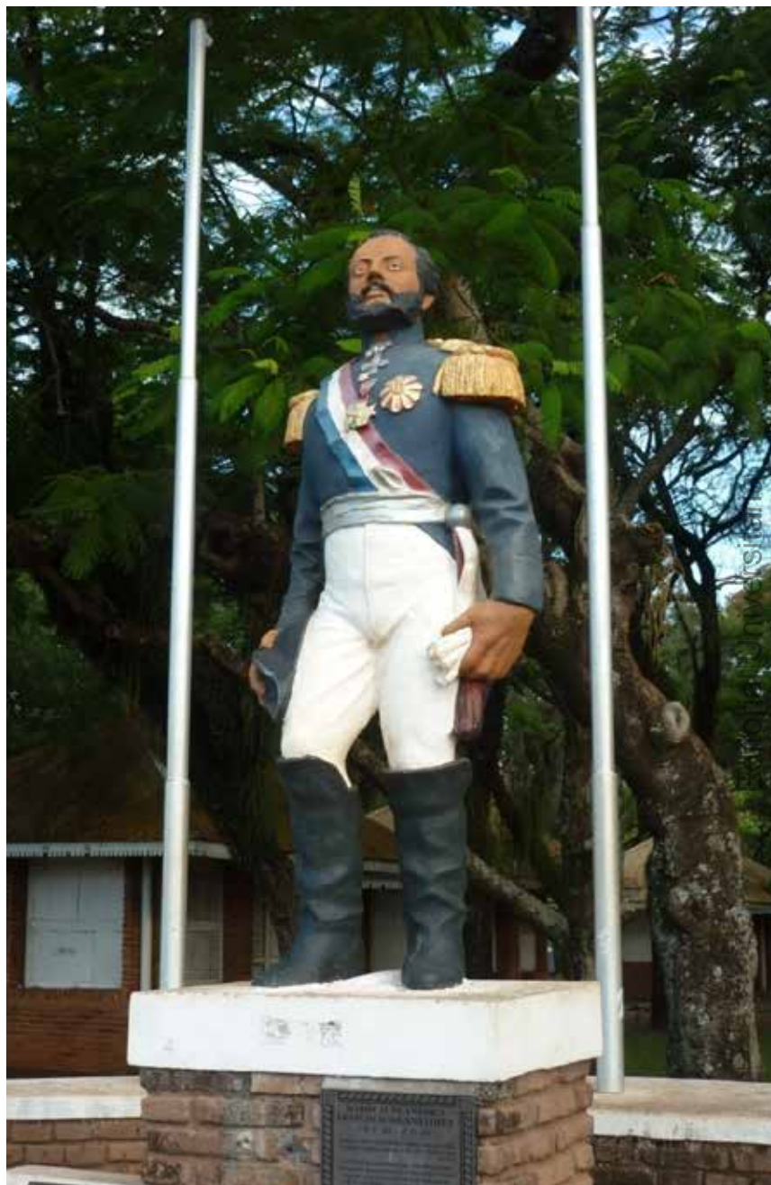
24 Homenaje a Francisco Solano Lopez, Parque Paraguayo, Posadas.