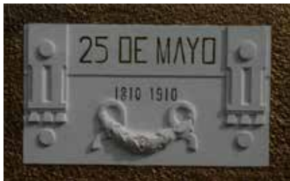
6 Placa del Centenario, 25 de Mayo 1810-1910, Posadas.