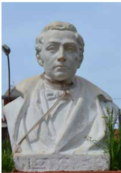
25 Busto de Mariano Moreno, Av. Mitre entre S. Lorenzo y Ayacucho, Posadas.