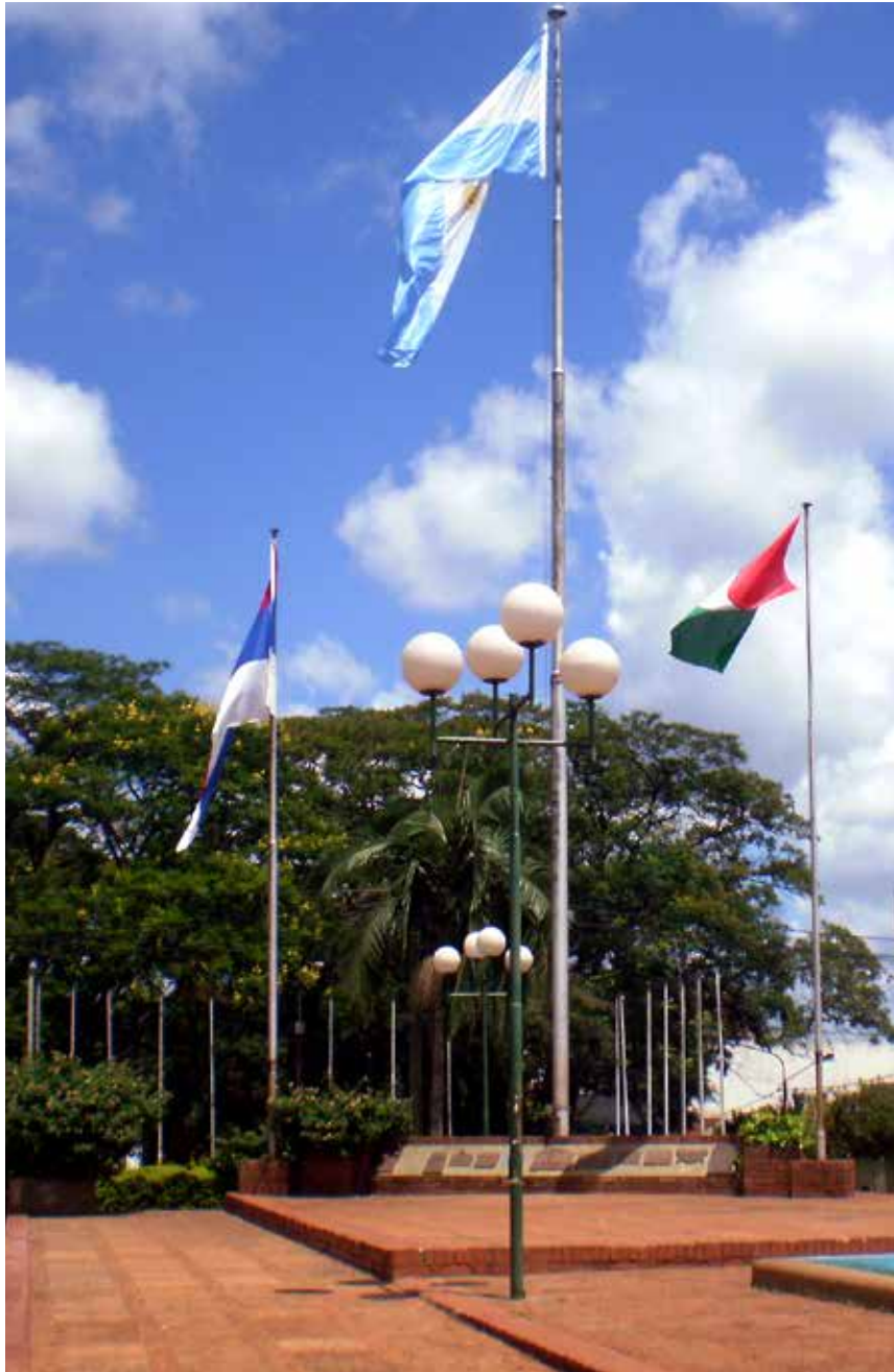
47 Vista general de los Mástiles, Centro Cívico previa demolición, Oberá.