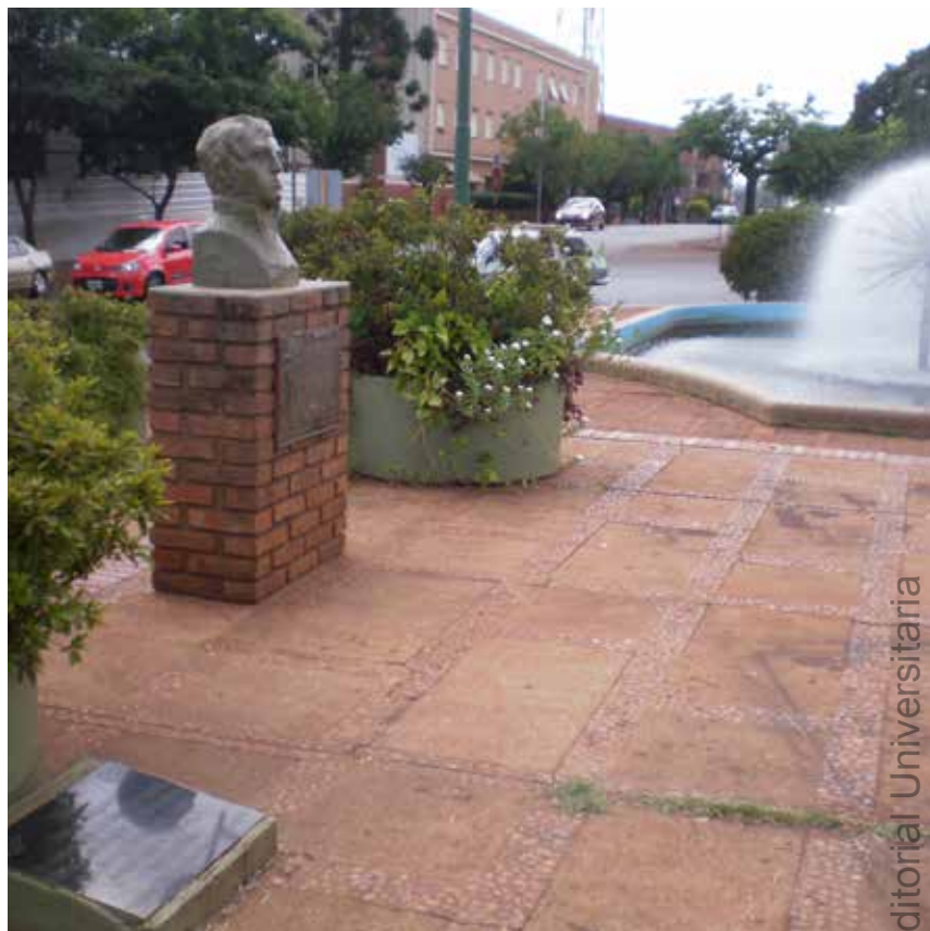
48 Vista del Busto a M. Belgrano, al fondo se observa la fuente de agua.