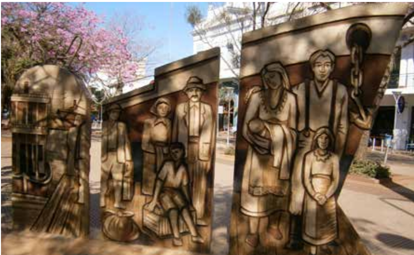
46 La otra cara del mural: Homenaje a los Inmigrantes, G. Rodriguez.