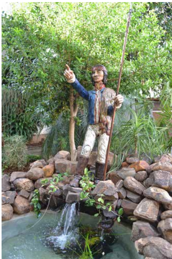
65 Figura policroma de A. Guacurarí, Jardín del Concejo Deliberante, Posadas.

A continuación se muestran imágenes de los monumentos en su homenaje.