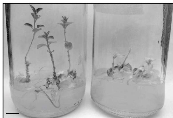
Figura 2: Sobrevivencia de Austrochthamalia teyucuaensis . Izquierda plantas que sobrevivieron. Derecha plantas que perecieron durante el ensayo. La barra indica 1 cm.

inactivas o no viables y existe una mayor mortalidad de las plántulas. La fragmentación de hábitat es uno de los factores que tienen un efecto negativo sobre la adecuación biológica de las plantas ya que ocasionan una reducción en la cantidad y calidad de semillas producidas. Los factores que disminuyen la cantidad de plantas obtenidas por semillas, debido a la baja calidad de estas, pueden transformarse en una amenaza para la sobrevivencia de las poblaciones a largo plazo (HENRÍQUEZ 2004). La baja cantidad de individuos en una población promueve la autofecundación (HERLIHY et al. 2002) y las plantas obtenidas de semillas por autofecundación producen menos flores que las provenientes de semillas por polinización cruzada, y por ende menor cantidad de frutos y semillas (JOHNSTON 1992). Los linajes de autofecundación tienen un potencial reducido para adaptarse a los ambientes cambiantes y por ende es menor su capacidad para persistir en el largo plazo (WRIGHT et al. 2013).