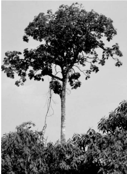
Figura 3: Árbol de “cacheta”, hábito de copa alta y copa en aglomerados

Los frutos son drupas redondeadas aplanadas, grisáceas de 5-10 mm de diámetro con 1-3 semillas por fruto, (ORTEGA TORRES et al. , 1989).