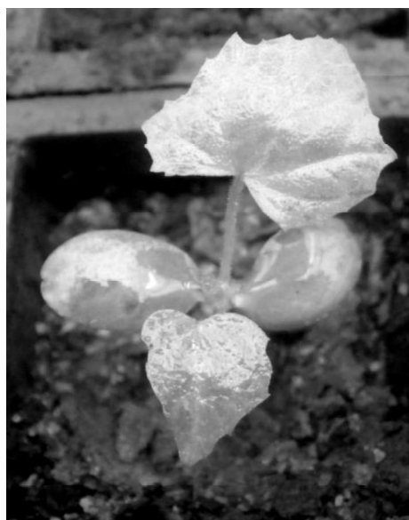
Figura 1: Plántula de “cacheta”, con cotiledones epígeos, primer y segundo par de hojas

Segundo par de hojas con las características morfológicas similares a las del primer par de hojas, pero de mayor tamaño.