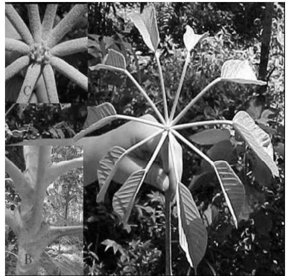
Figura 2: “Cacheta”. A: Hoja palmaticompuesta. B: Rámulo con estípulas intrapeciolares. C: Hojas con estípelas.

Hojas compuesto-palmadas; de filotaxis alterna, de 90 cm (69-114) de longitud total; pecioladas, peciolo de 55cm (37-76) de largo; la base engrosada en un pulvínulo lenticelado, envolvente, provisto de lenticelas similares a las del tallo pero más pequeñas; estipuladas, estípulas concrecentes intrapeciolares ( Fig. 2 ). Foliolos en número de 5 a 11 por hoja; pecioulados; peciólulos de 8 cm (4-14) de longitud y 0,3 cm (0,2-0,4 cm) de diámetro; ligeramente canaliculados; en el punto de unión de los peciólulos con el extremo del peciolo se observa la presencia de pequeños apéndices. Lámina foliolar de 25 cm (15-35) de long., y 11 cm (6-16) de lat., obovados, ligeramente abarquillados; borde entero en la mitad inferior y aserrado en la mitad superior; ápice acuminado a largamente acuminado; base redondeada a ligeramente cordada, en ocasiones truncada. Los folíolos presentan una nervadura principal muy prominente, engrosada hacia la base de la lámina; superficie ligeramente rugosa y con pilosidad variada: en la cara adaxial con pelos solitarios, erectos y prontamente caducos y la abaxial con tomento o escasa pubescencia; discolores, haz verde claro y envés verde blanquecino.