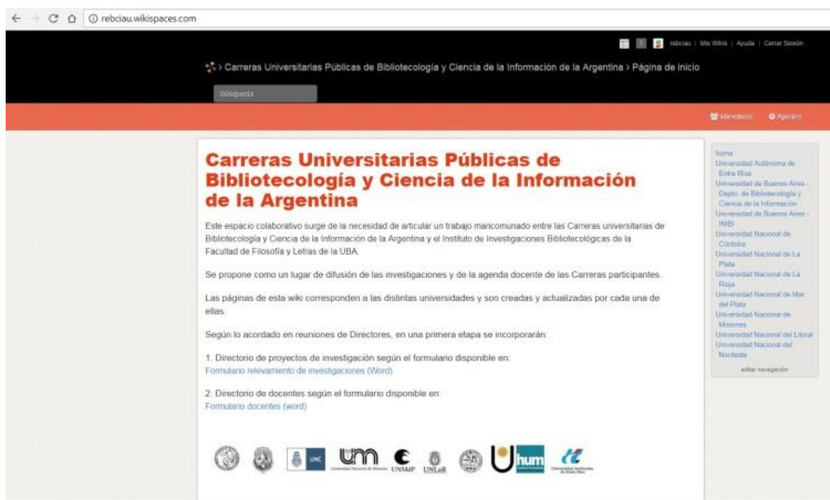
Figura 1. Página inicial del Directorio de Docentes e Investigadores

La arquitectura del sitio es simple; cuenta con una página de inicio breve donde se explicita el objetivo del recurso. Incluye los enlaces a los formularios consensuados para cargar los datos de los docentes y de las investigaciones y las imágenes de los logos institucionales de las universidades participantes. Un menú lateral permite el acceso a cada Carrera. Desde este menú se accede a la información que ingresa cada Carrera sobre sus docentes y sobre sus proyectos de investigación.