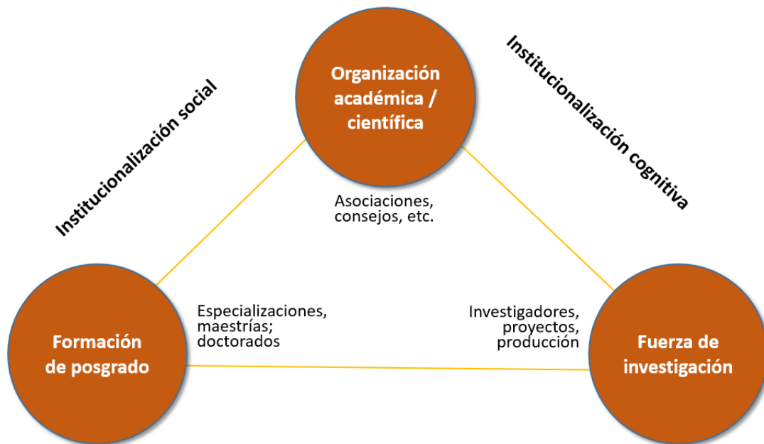
Figura 1. Triángulo de institucionalización científica