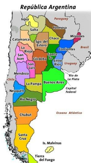
Mapa 1: Misiones en el país