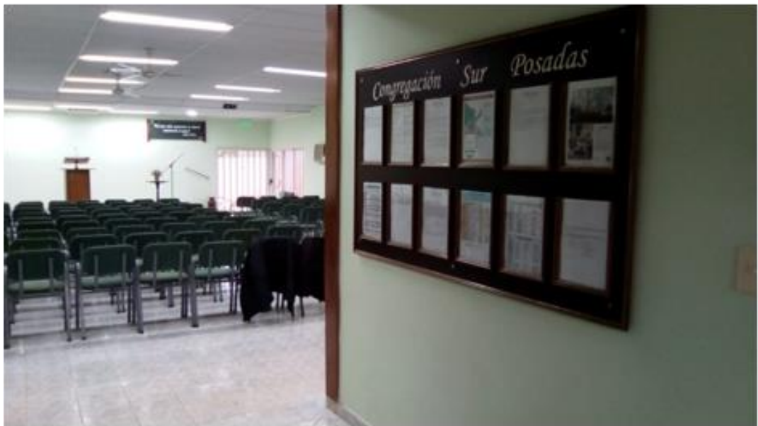
Foto tomada por el autor, de parte del interior del Salón del Reino Posadas Sur

Nota aclaratoria: intencionalmente he evitado que aparezcan en las fotos los miembros. He preferido respetar su deseo de anonimato por cuestiones de principios de “humildad” y “discreción” que los testigos sostienen.