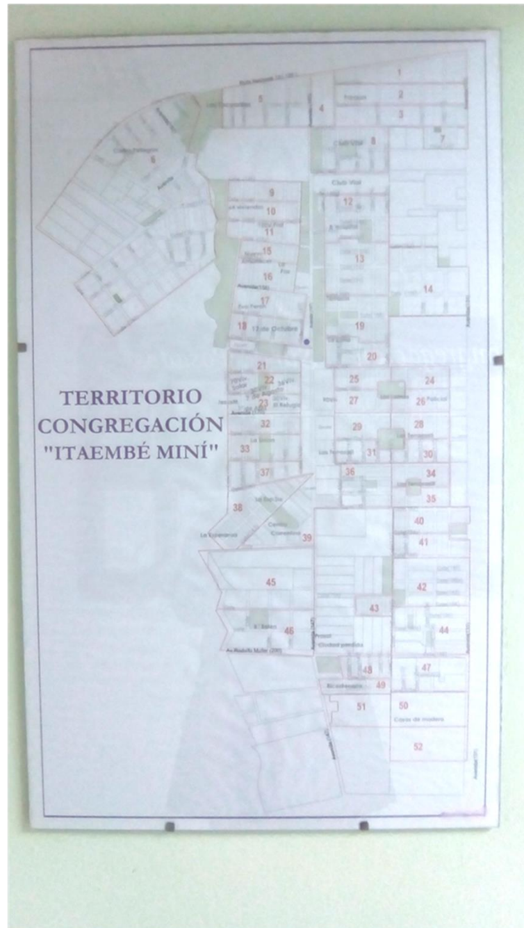
Foto tomada en el Salón del Reino por el autor, del mapa del territorio que le corresponde a la Congregación "Itaembé Mini" en la ciudad de Posadas