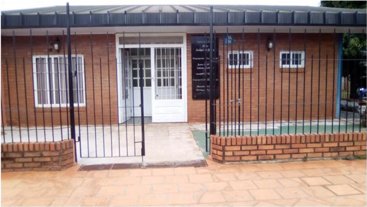
Foto tomada por el autor, del frente del Salón del Reino de la Congregación Sur Posadas

- Conversión y obediencia, en una congregación de testigos de Jehová en la Ciudad de Posadas -