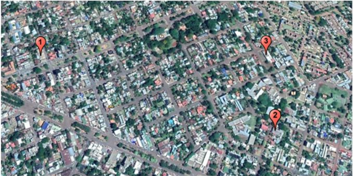
Figura 1: Establecimientos deportivos seleccionados.

La ubicación de los establecimientos seleccionados se observan a continuación (figura 1), punto 1 es una cancha de futbol 5, el punto 2 es un Gimnasio y el punto 3 es una cancha de paddle.