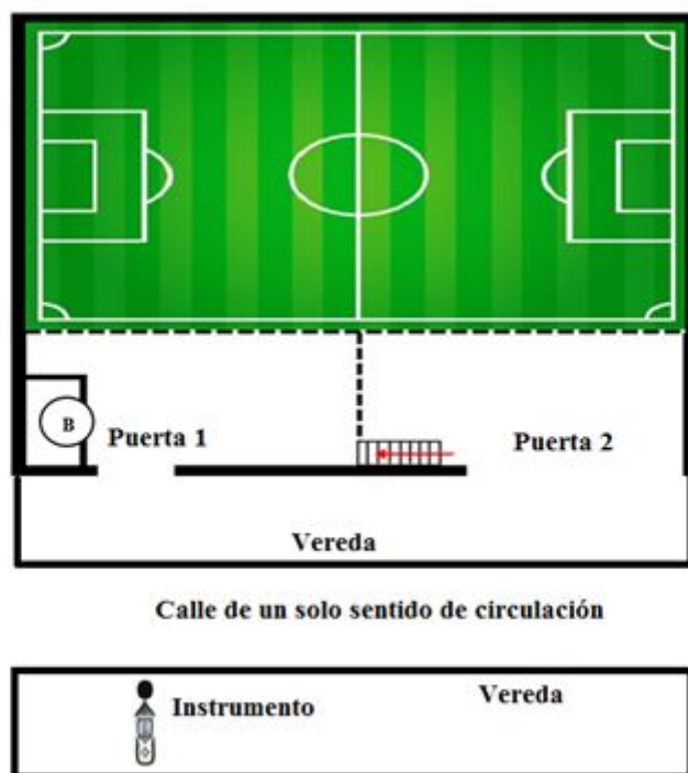
Figura 2: Ubicación del Instrumento cancha de futbol 5.

Evento: XXIV Jornada de Pesquisa - Participante ESTRANGEIRO