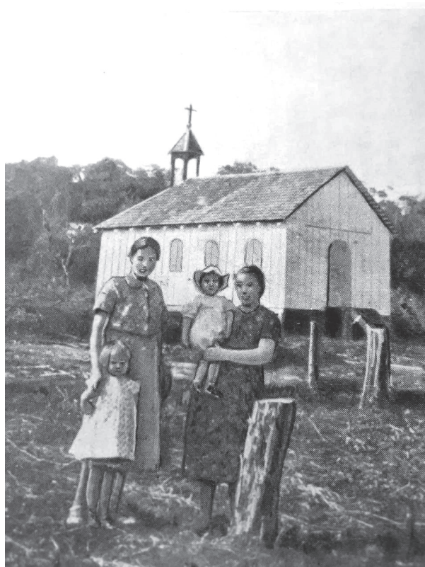
Figura 5. Mujeres reunidas con sus niños en la Iglesia de Oberá (c. 1937).