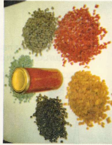
TROZOS DE YACARATIA CONFITADO Y MELAZA DE FIBRAS DE MADERA