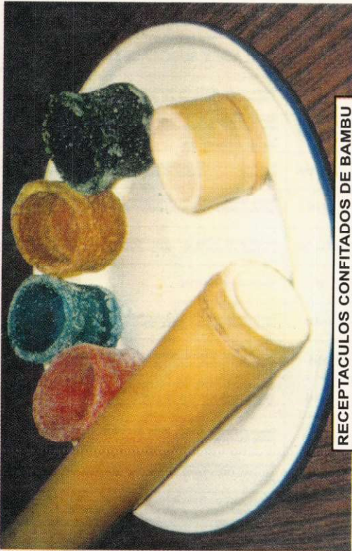
RECEPTACULOS CONFITADOS DE BAMBU