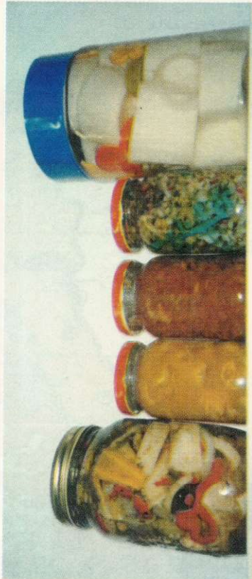
ANTIPASTO DE BAMBU BAMBUE EN ALMIBAR MERMELADA DE BAMBU ADEREZO DE BAMBU RECEPTACULOS DE BAMBU