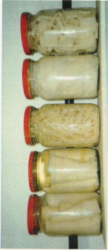
BROTE DE BAMBU TROZOS DE BAMBU FIDEOS DE BAMBU LAMINAS DE BAMBU RAVIOLES DE BAMBU