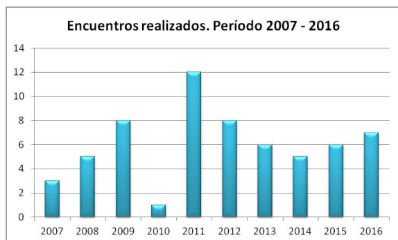
Gráfico N° 1: Temas desarrollados en el ciclo Ñeé de Turismo..

- Turismo de reuniones, turismo temático, calidad turística y defensoría del turista: profundización de conocimientos específicos de la disciplina.