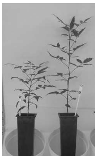
Foto 5: Astronium balansae Engl. Plantines en tubetes a los 3 meses.