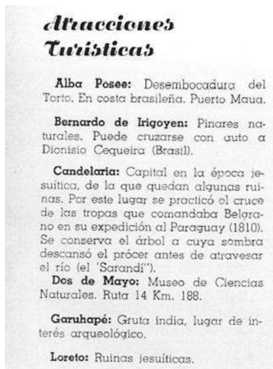
Figura 6. Mención de Garuhapé como lugar de interés arqueológico.

La única referencia de Garuhapé como un lugar de importancia turística y arqueológica se encuentra en la Guía Turística del año 1970 (Figura 6). Además, se pone de manifiesto la importancia de la localidad en términos de organización institucional, ya que por ejemplo se destaca la existencia de un Registro Civil (Figura 7) y aparecen datos específicos sobre la densidad demográfica (Figura 8). Más recientemente, en el Censo del INDEC del año 2001 la localidad de Garuhapé contaba aproximadamente con 8300 habitantes.