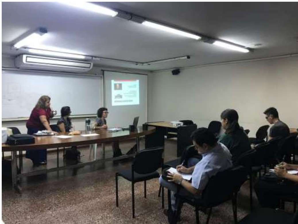
Figura 9. Clases del seminario “ Arqueología de Misiones ”.

del sitio (Figura 9 y 10). En ese primer acercamiento, se detectaron tareas directas a implementar que están relacionadas con la información disponible a los turistas, visitantes y personal del camping en primer lugar. A partir del impacto generado en estudiantes de las distintas carreras de grado (Historia y Antropología Social), decidimos desarrollar esta propuesta de innovación para el desarrollo local, promoviendo la transferencia de conocimientos para la activación y la valoración patrimonial.