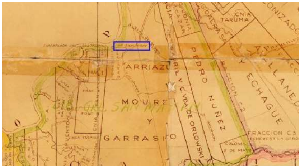
Figura 5. Mapa (fragmento) de la Provincia de Misiones de 1955.