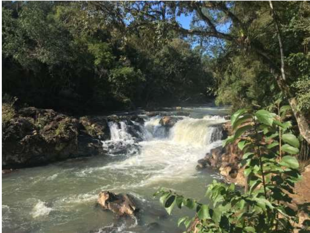
Figura 2. Fotografía tomada en la salida de campo del seminario “ Arqueología de Misiones ” que destaca los valores ambientales y turísticos de la Gruta Tres de Mayo.

Figura 1. a) Localización de la Gruta Tres de Mayo, Garuhapé, provincia de Misiones. b) Foto de la excavación de la campaña del año 2013.