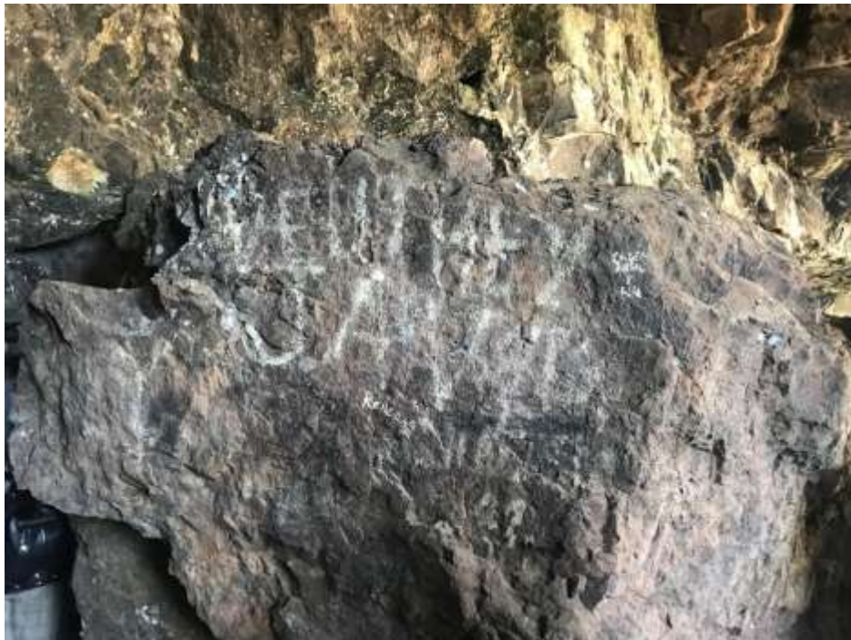
Figura 12. Graffiti registrado en uno de los paredones internos de la Gruta.