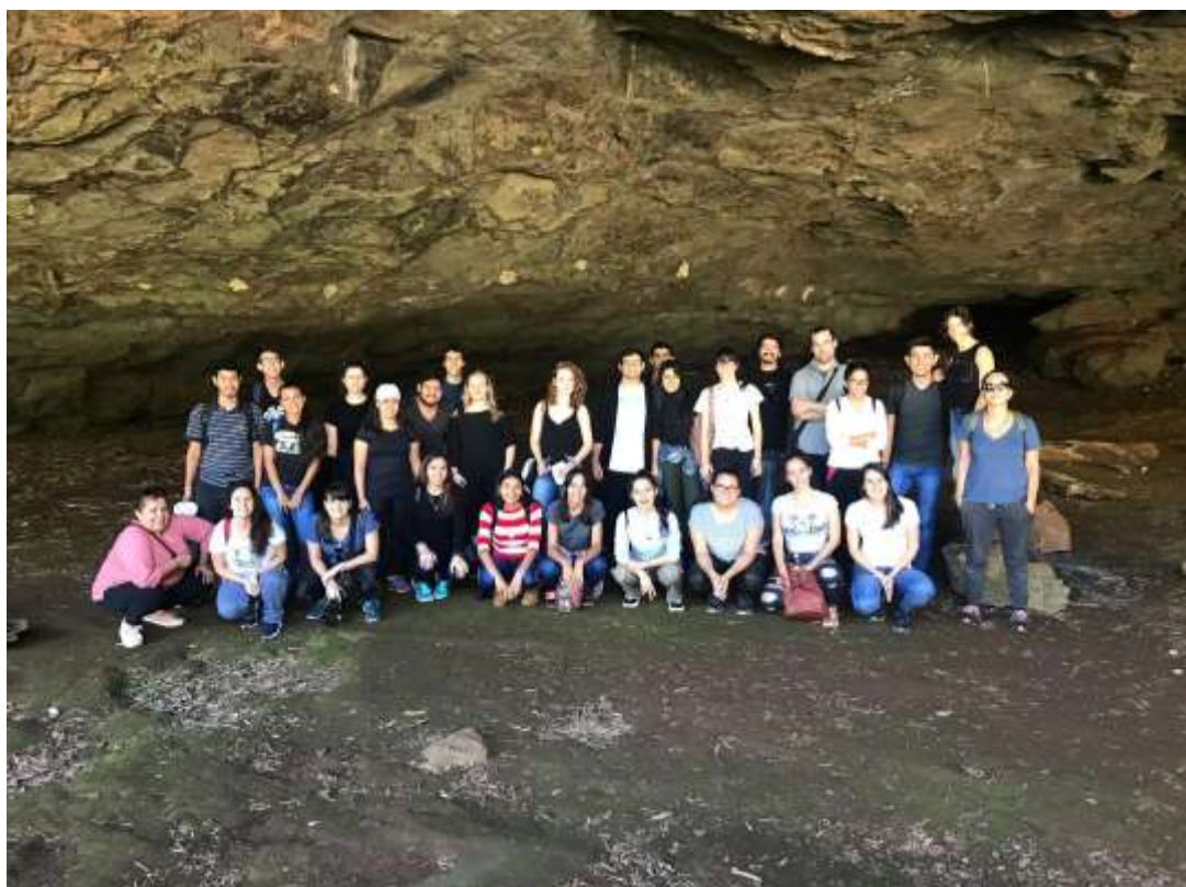
Figura 10. Grupo en la salida de campo, fotografía tomada dentro de la Gruta.

Además, consideramos relevante desarrollar ciertos fundamentos metodológicos que sustenten programas y proyectos educativos de innovación respecto de la problemática que nuclea a los pueblos históricos de Misiones, aportando desde la arqueología y la historia regional, respecto de un período en el que las fuentes escritas no existen. De esta manera, nuestro proyecto se inscribe en una investigación interdisciplinaria generada en la Universidad Nacional de Misiones que fomenta la inclusión de la arqueología como enfoque necesario y de arqueólogos/as, historiadores y profesionales del turismo para el tratamiento de una problemática social referida al uso activo del patrimonio arqueológico y comunitario como recurso turístico sustentable.