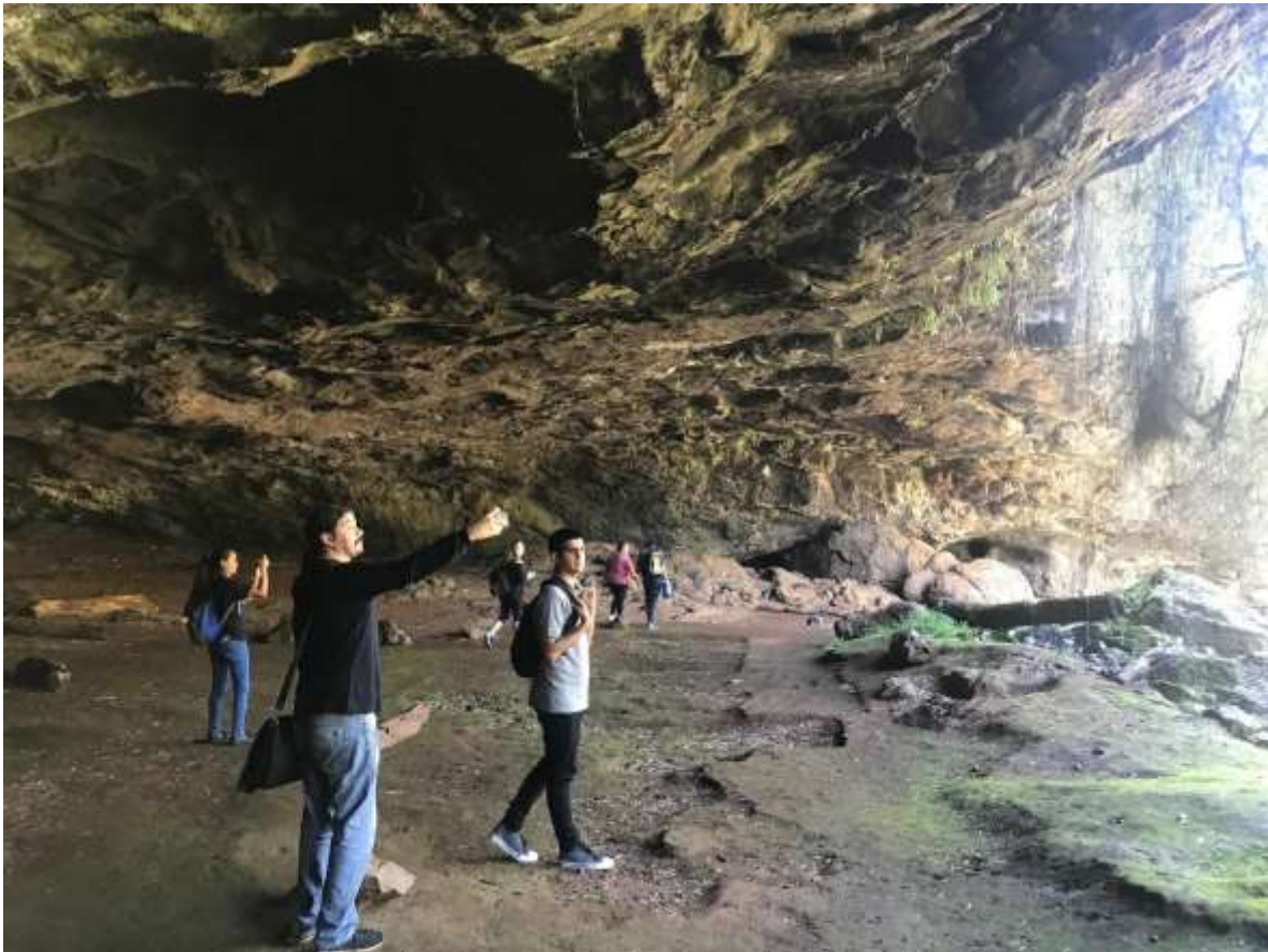
Figura 13. Área interna de la Gruta. Nótese cómo los visitantes ingresan a la zona donde en el año 2013 se plantearon las cuadrículas de excavación.