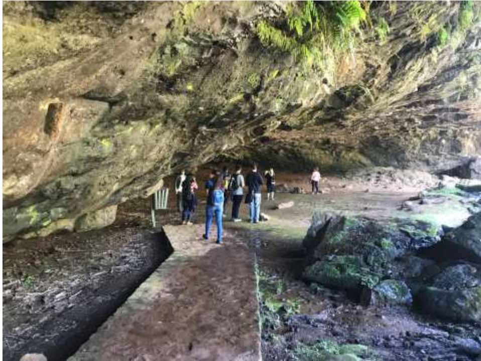
Figura 11. Rampa de acceso al sitio.