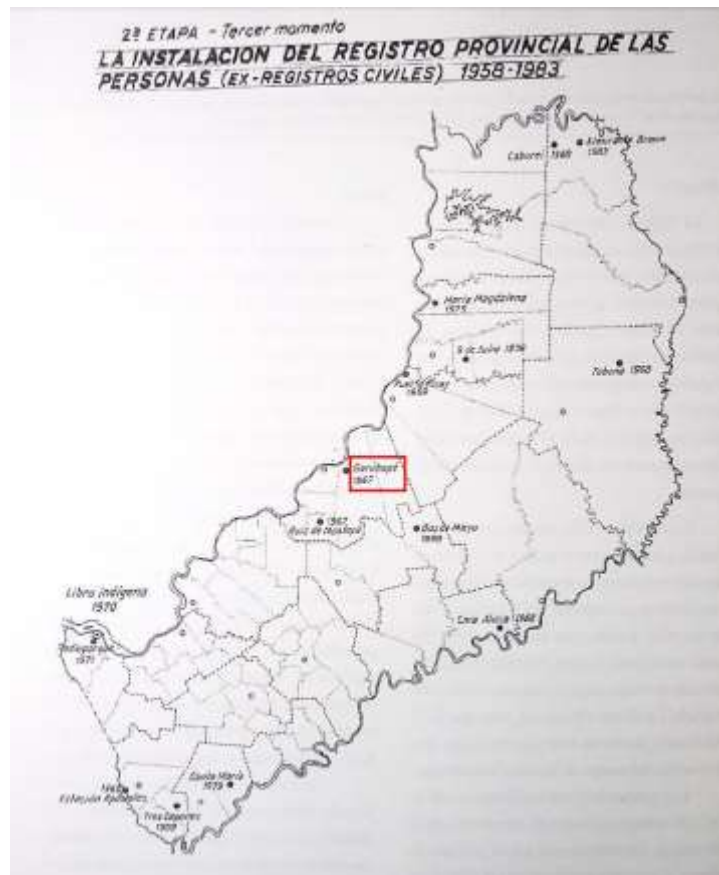
Figura 7. Creación del Registro Civil de Garuhapé en 1967. Fuente: (Schiavoni, 2002)