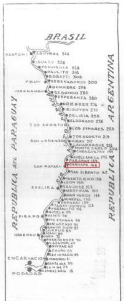
Figura 3. Principales puertos argentinos y paraguayos en 1943.

En las fuentes locales histórico-cartográficas, la actual zona donde se encuentra el municipio se ha conocido a lo largo del siglo XX bajo distintas denominaciones tales como puerto Carupé (1907), Garuhape (1909), Puerto Murphy (1914, 1930), Garuhapé (1943), entre otros. En este sentido, pese a la diversidad de denominaciones que fueron atribuidas al área estudiada, su ubicación permaneció invariable. A modo de ilustración, en las Figuras 3, 4 y 5, provenientes tanto de fuentes locales como nacionales, se puede apreciar la denominación “Garuhapé” en el territorio misionero.