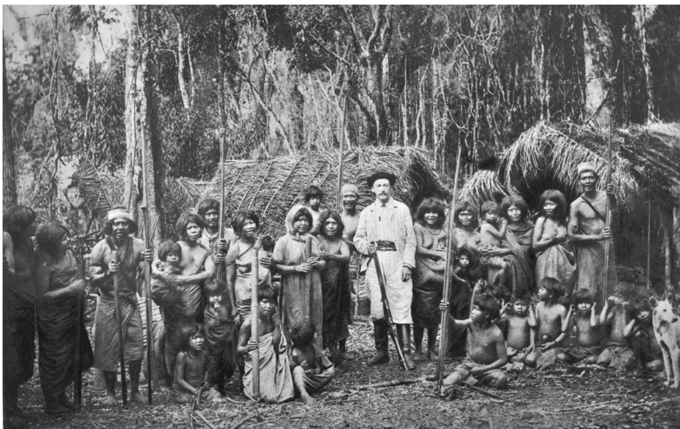
Postal: Indios cainguás, Departamento de Alto Paraná, Paraguay.