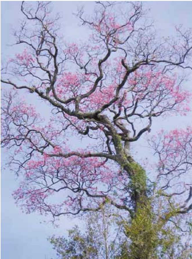
Lapacho o tajy florecido en la selva.