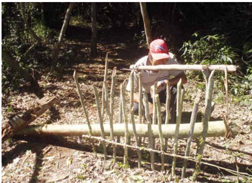
Trampa monde .

El arco y la flecha han sido abandonados por los mbya. Los más jóvenes de las aldeas explican este cambio diciendo: "nosotros los jóvenes ya no sabemos cómo se hace", "no vamos más al monte porque no hay más bichos" o "los abuelos ya no nos enseñaron a usar". Las causas son siempre las mismas: la reducción de la selva por la invasión de los colonos y las empresas. Hoy en día, la "marisca" –salir a recolectar y eventualmente cazar– suele incorporar armas de fuego aunque su uso depende de la disponibilidad de dinero para comprar municiones.