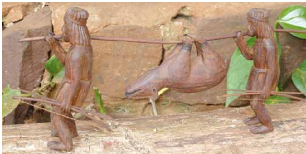
Figuras en madera representando el transporte de un kochi o pecarí labiado. Artesano: Vicente Ramos.

Esta plegaria, con distintas variantes, debe decirse toda vez que los mbya visitan un curso de agua al que no suelen concurrir o que les resulta