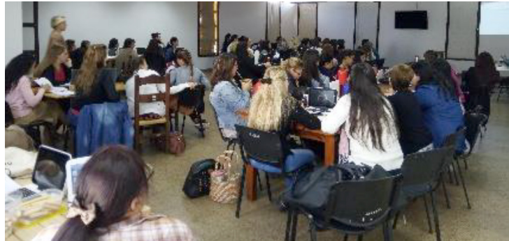
Figura 2: Grupo de participantes del curso Programación y Robótica I.

gramación propias de la placa de circuitos integrados de Arduino montando pequeños sistemas de control de sensores y actuadores.