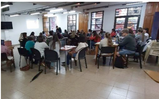
Figura 1: Grupo de docentes en el primer encuentro del curso Pensamiento Computacional y Programación del 2018.

En el primer proyecto, tanto en la primera como en la segunda edición, el eje vertebrador, siguiendo los Núcleos de Aprendizajes Prioritarios de nivel secundario (2011) fueron contenidos y objetivos propios del espacio curricular de Educación Tecnológica: reconocimiento del modo de programar las acciones en los dispositivos que reemplazan al hombre en la toma de decisiones; reflexión sobre las acciones de ejecución y control y grado de automatización en diversos medios técnicos; identificación de estructuras de control (bucles) y secuencias de algoritmos mediante la programación en diferentes software y, por último, análisis del fenómeno de la programación y la robótica en el contexto educativo actual.