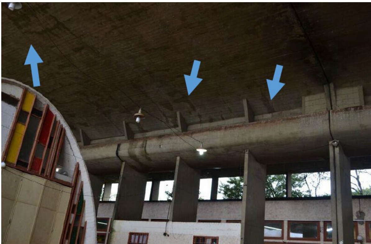
Figura 14: Fisuras en el techo de la Escuela Normal Superior N° 1, Leandro N. Alem

Fisuras lineales: surgieron por la falta de armadura transversal, ya que en la década del 1.950 se usaba una separación de hierros de 30 cm, un 33% más distante al de la actualidad que es de 20 cm.