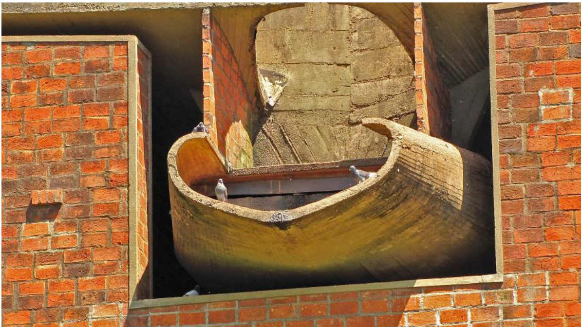
Figuras 9 y 10: Gárgolas de hormigón, Escuela Normal Superior Nº 1, Leandro N. Alem.

Cubierta: la losa posee actualmente una protección de membrana de aluminio y brea. Su colocación en el límite perimetral que conforma el goterón no fue ejecutada con el suficiente solape, lo que produce un levantamiento del material por el efecto del viento y