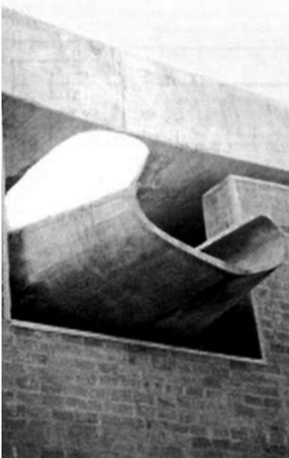
Figuras 9 y 10: Gárgolas de hormigón, Escuela Normal Superior Nº 1, Leandro N. Alem.

Fundaciones: las bases del edificio han sido ejecutadas en perfectas condiciones, hecho que podemos detectar a partir de la ausencia de fisuras en paredes o tabiques.