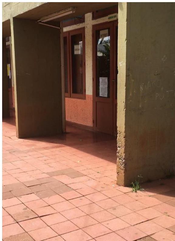
Figura 4: Tabiques de hormigón, Escuela Normal Superior Nº 1, Leandro N. Alem.

La clara confianza en las nuevas tecnologías y el intento de huir de las configuraciones espaciales más simples, tendiendo a soluciones que expresen la plasticidad de los nuevos materiales como hormigón, cristal, aluminio, etc., se recreará en muchas obras de estos arquitectos, tendiendo a caminos