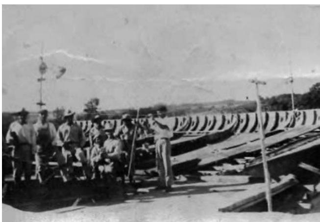
Figuras 7: Imágenes de los años de construcción (recopiladas por el grupo MMM3).