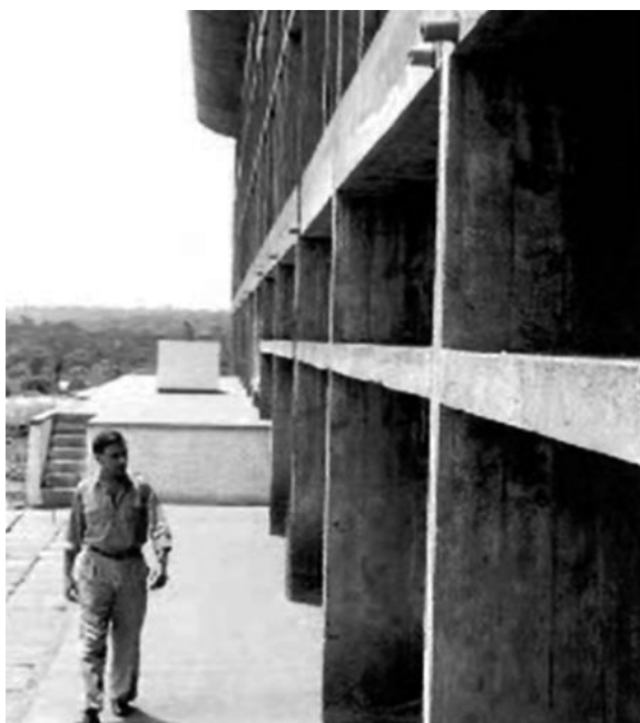
Figuras 8: Imágenes de los años de construcción.

de la delgadez del tabique, el colado se ejecutó en general sin producción de oquedades.