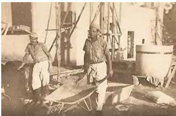
Figuras 5: Imágenes de los años de construcción (recopiladas por el grupo MMM3).

Durabilidad: la calidad del hormigón en cuanto a su composición de cemento arena y piedra, es buena. Esto se deduce que, a pesar