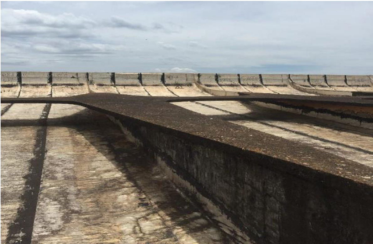
Figuras 11: Techo de la Escuela Normal Superior Nº 1, Leandro N. Alem.