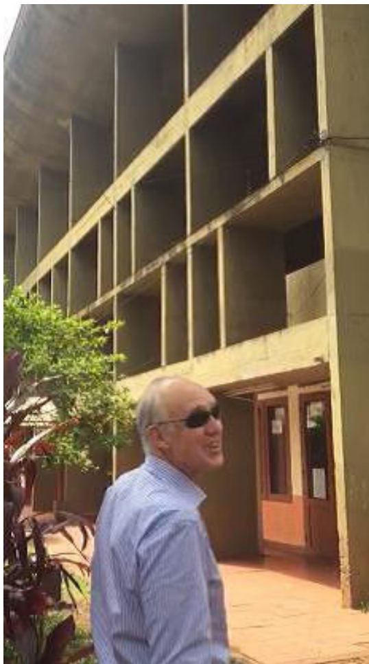
Figura 3: Recorrido y detección de patologías en el bien patrimonial, Escuela Normal Superior Nº 1, Leandro N. Alem.

recta, esta herramienta permitirá fácilmente ser consultada y ejecutada por el personal de limpieza y mantenimiento diario de la escuela. Este manual de uso del edificio será confeccionado por nuestro equipo de trabajo y entregado a las autoridades próximamente.