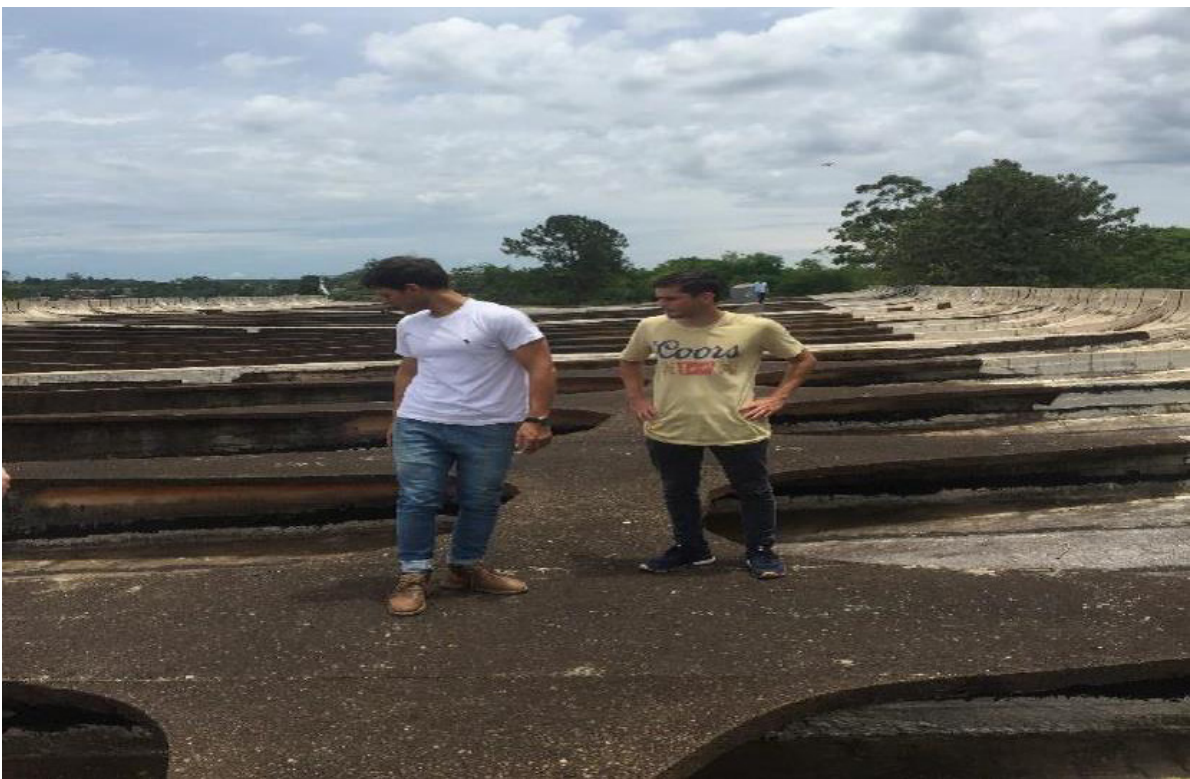
Figuras 12: Techo de la Escuela Normal Superior Nº 1, Leandro N. Alem.