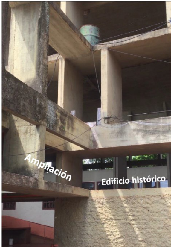
Figura 13: Ampliaciones de la Escuela Normal Superior N° 1, Leandro N. Alem.

el ingreso del agua entre la capa de recubrimiento y la losa.