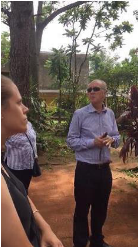
Figura 2: Recorrido y detección de patologías en el bien patrimonial, Escuela Normal Superior Nº 1, Leandro N. Alem.

En la segunda clase teórica se habló sobre el Origen de las fisuras, disgregaciones y