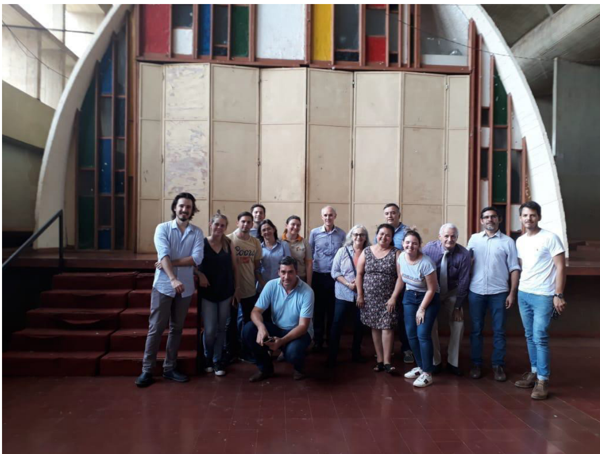
Figura 15: Parte del equipo del MMM3 y del FNA en la Escuela Nº 1 de Leandro N. Alem.

actividades de articulación que tiendan a la visibilización y preservación de los bienes patrimoniales de Misiones.