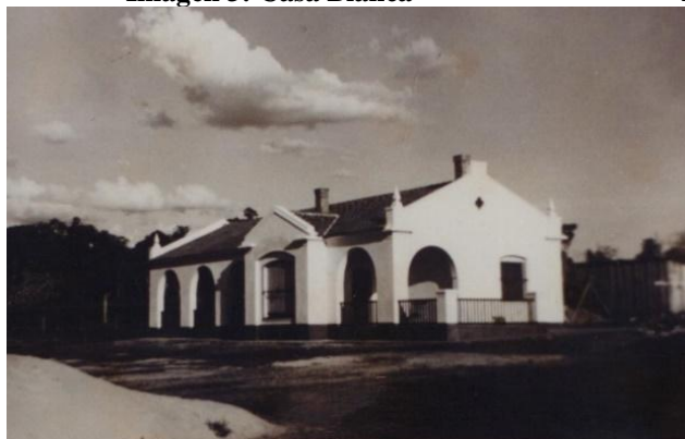
Imagen 3: Casa Blanca