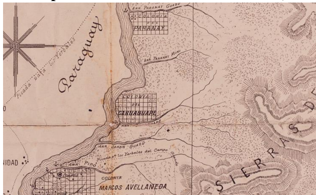
Mapa 1: Las Misiones del Alto Paraná (1871 y 1879)

nacional desde el Departamento de Trabajo- destacaba la existencia de un obraje en 3 de Mayo, de Pedro C. Labat, y otro en “Garuapé”, que estaba “actualmente paralizado” (Gallero, 2016). No obstante, antes del proceso de federalización de Misiones (1881), el lugar era reconocido como parte del antiguo asentamiento agrícola de la “Colonia Carnaguapé”, también presente en la cartografía histórica producida entre 1871 y 1886.