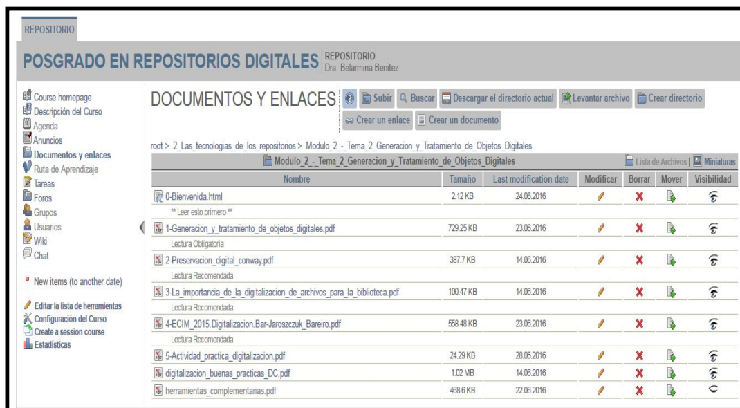
Fig. 3. Material del módulo “Generación y tratamiento de objetos digitales”