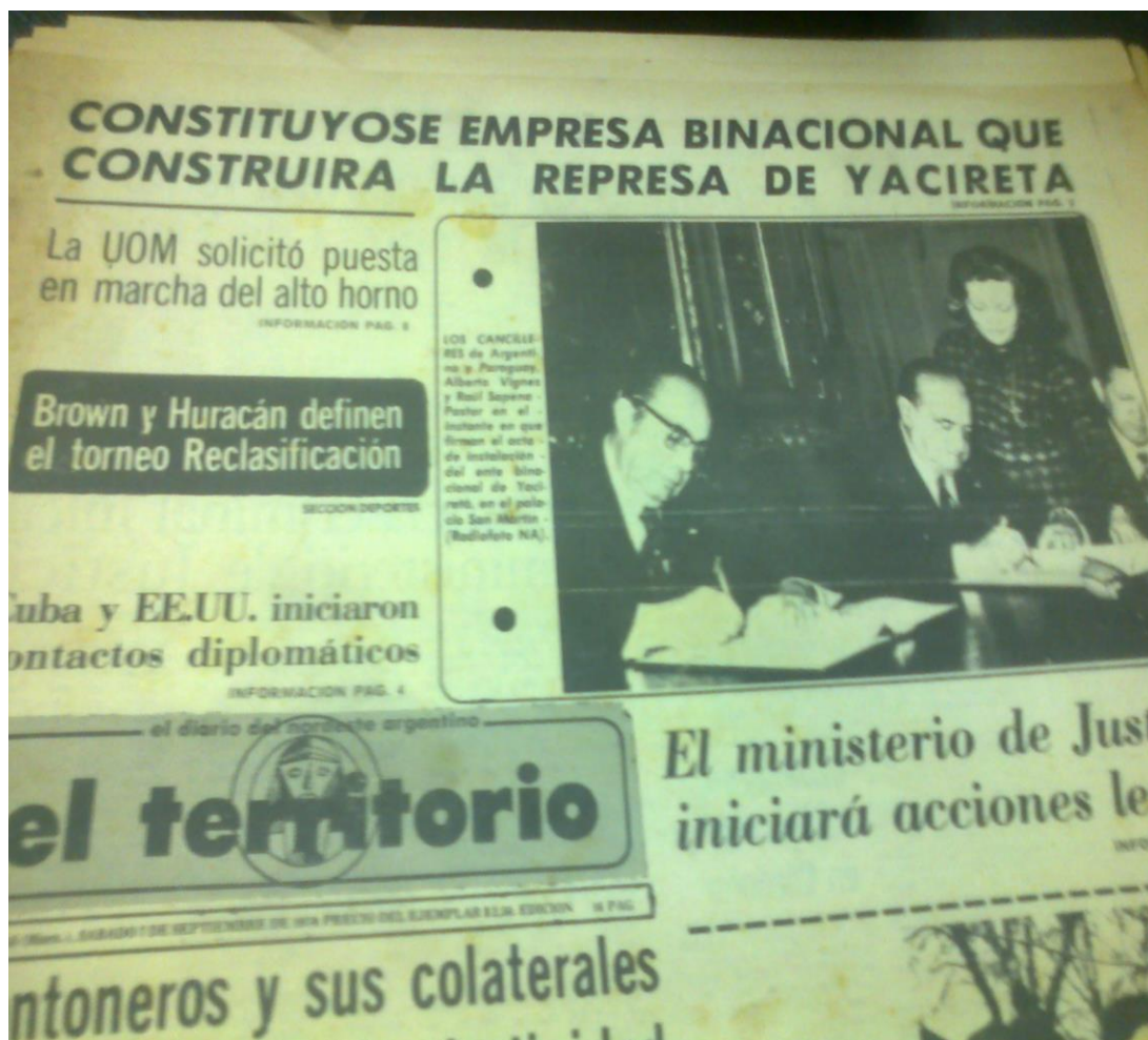
Publicación del diario El Territorio del 7 de septiembre 1974 sobre la conformación de la EBY.

Si bien el Tratado para la construcción de Yacyretá se firma en diciembre del año 1973, es en septiembre del año siguiente que se conforma la Entidad Binacional Yacyretá. El 8 de octubre de ese año, el Concejo Deliberante de la ciudad de Posadas sancionó un decreto en el que se estableció la prohibición de innovar, esto es, no se podía construir ni vender, aquellos terrenos que se encontraban ubicados sobre la orilla del río Paraná. Posteriormente, se procedió a censar a la población asentada sobre las tierras que serían inundadas con la construcción de la represa.