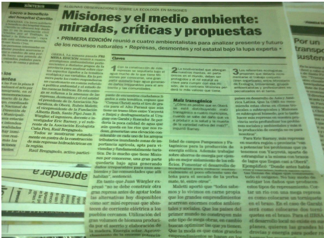
Entre los problemas ambientales, se señala a las represas hidroeléctricas. Primera Edición, 17 de mayo de 2011.