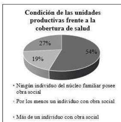
Gráfico 1. Cobertura social de la población de estudio. Graph 1. Social security of the study population.

El INDEC (2010) informa que, en el segundo trimestre del año 2017, el 69,8% de la población de Misiones tenía algún tipo de cobertura de salud, un porcentaje levemente superior al valor observado en el promedio regional y en el promedio país.