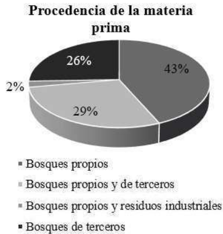
Gráfico 4. Procedencia de la materia prima. Graph 4. Origin of the raw material.

La duración del ciclo de carbonización, depende del tamaño del horno y de las técnicas empleadas por cada productor; varían entre 6 y 15 días, contando desde la etapa de carga del horno hasta el empaquetado y disposición para la venta.