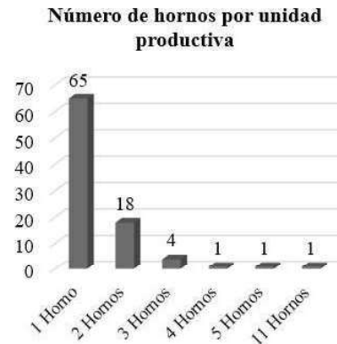
Gráfico 3. Número de hornos por unidades productiva. Graph 3. Number of kilns per productive units.

chacra, y en cuanto le es posible venden su fuerza laboral, en general destinados a empleos temporarios “changas”.