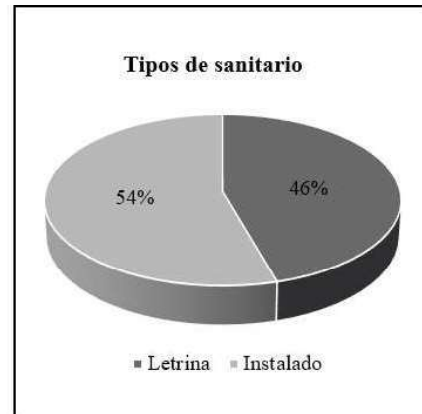
Gráfico 2. Tipo de sanitario utilizado por las familias. Graph 2. Type of sanitary used by families.

En cuanto al tipo de sanitario utilizado, los datos arrojan que casi un 50% de las familias utilizan el baño tipo letrina, como se observa en el grafico 2. Esto se debe a que sus bajos ingresos económicos no les permite realizar inversiones en infraestructuras básicas para el bienestar familiar.