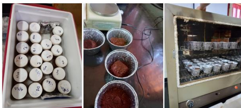
Figura 4. procesamiento de muestras de suelo, transporte, pesado utilizando balanza de precisión y secado en estufa.

Para estimar el contenido de agua y la densidad aparente del suelo se tomaron 5 muestras dentro de cada parcela a finales del invierno. Las muestras fueron transportadas en heladerita para evitar la pérdida de humedad hasta ser procesadas en laboratorio (Figura 4). En el laboratorio fueron pesadas para calcular el peso húmedo y luego secadas en estufa por 48 hs. (105°C) hasta alcanzar un peso constante, luego vueltas a pesar para obtener el peso seco. El contenido de humedad se calculó por diferencia de peso húmedo y seco, dividido el peso húmedo y la densidad aparente dividiendo el peso seco por el volumen del cilindro utilizado para tomar la muestra.