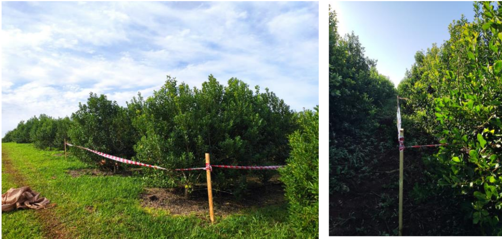
Figura 2. Delimitación de parcelas experimentales de 10 x 10 m

Cada sitio funcionara como una réplica en un diseño de muestreo aleatorizado por lo que se seleccionaran aquellos con condiciones homogéneas en cuanto a la edad, densidad de plantación y manejo. Dentro de los sitios se marcaron parcelas de 10 m x 10 m en donde se realizaron los muestreos correspondientes a los objetivos 1, 2 y 5 (Figura 2). Para el objetivo 4 se utilizaron parcelas de media hectárea en donde se distribuyeron las trampas.