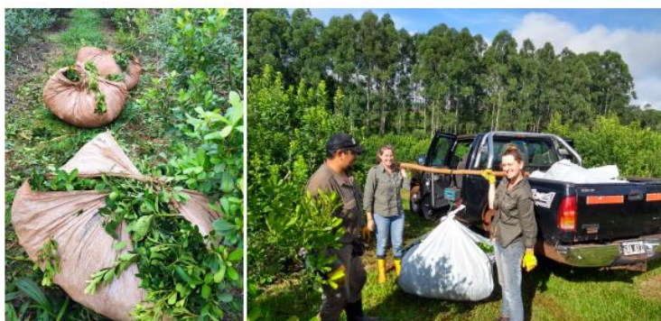
Figura 7. detalle de cosecha de las parcelas y pesaje in situ .