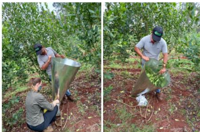
Figura 6. muestreo de enemigos naturales utilizando el método del embudo para la colecta.

Las colectas fueron realizadas directamente en las plantas de yerba mate, con la ayuda de un embudo de chapa galvanizada, midiendo 1 m de altura, 62 cm de diámetro en la abertura superior y 15 cm de diámetro en la abertura inferior, donde se colocó una bolsa de plástico unida con elástico (Figura 6). Los muestreos se realizaron mensualmente en 10 plantas de yerba mate por sitio de estudio, escogidos al azar. Las ramas de yerba mate fueron agrupados manualmente y agitados 3 veces dentro del embudo. Para la homogeneización de las colectas, el número de ramas fueron padronizadas de manera de llenar su abertura superior. Los insectos colectados en las bolsas fueron llevados al laboratorio y luego fueron acondicionados en alcohol 70 %. Los especímenes de enemigos naturales, fueron cuantificados teniendo en cuenta a que orden pertenecen. Esta actividad tendrá una duración de 18 meses.