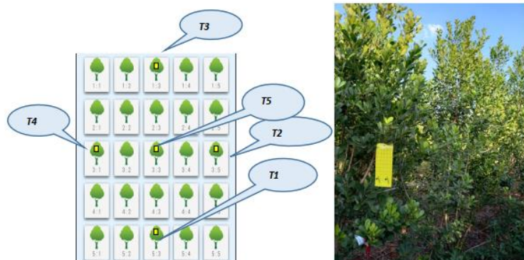
Figura 5. diseño de instalación de trampas adhesivas amarillas (izq.) y trampa adhesiva amarilla colocada a 1.7 m del nivel del suelo (der.).