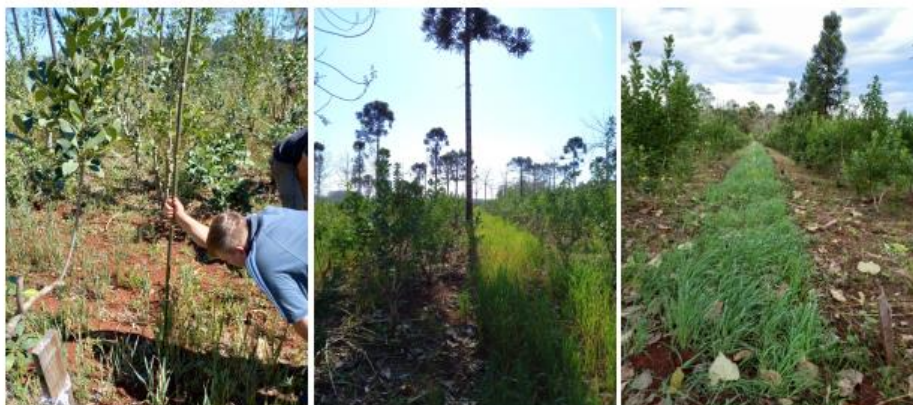
Figura 3. muestreo de cobertura vegetal a través del método de intercepción puntual y detalle de coberturas implantadas.