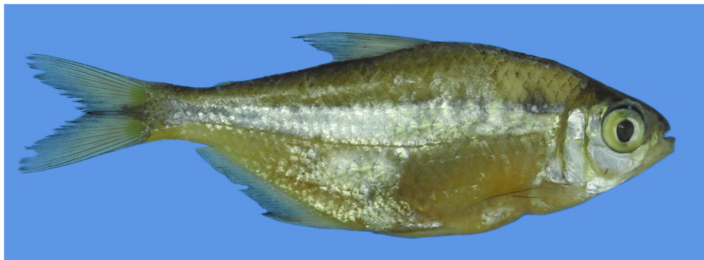
Figura 2. Psalidodon dissensus Lucena & Thofehrn, 2013.