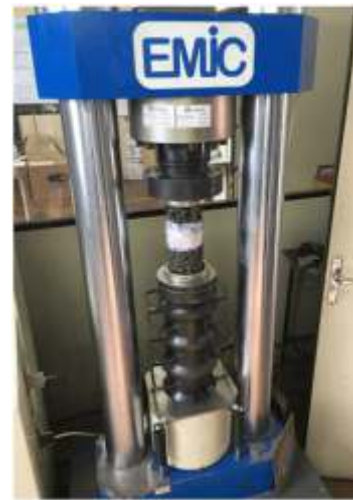
Fig. 4. Realização do ensaio de Resistência à Tração na Flexão.