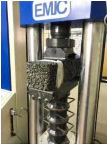
Fig. 3. Ensaio de Resistência à Compressão.