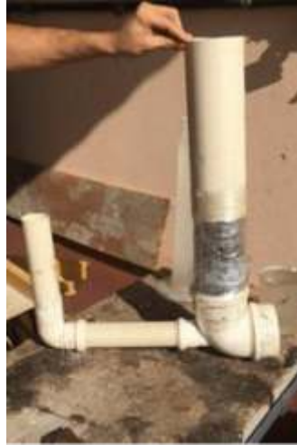
Fig. 2. Permeâmetro utilizado no ensaio de Condutividade Hidráulica.

A partir das leituras de tempo durante a realização do ensaio foi determinado o coeficiente de permeabilidade de acordo com (1).