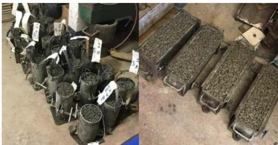
Fig. 1. Corpos de prova moldados.

A Fig.1 representa os corpos de prova cilíndricos e prismáticos.