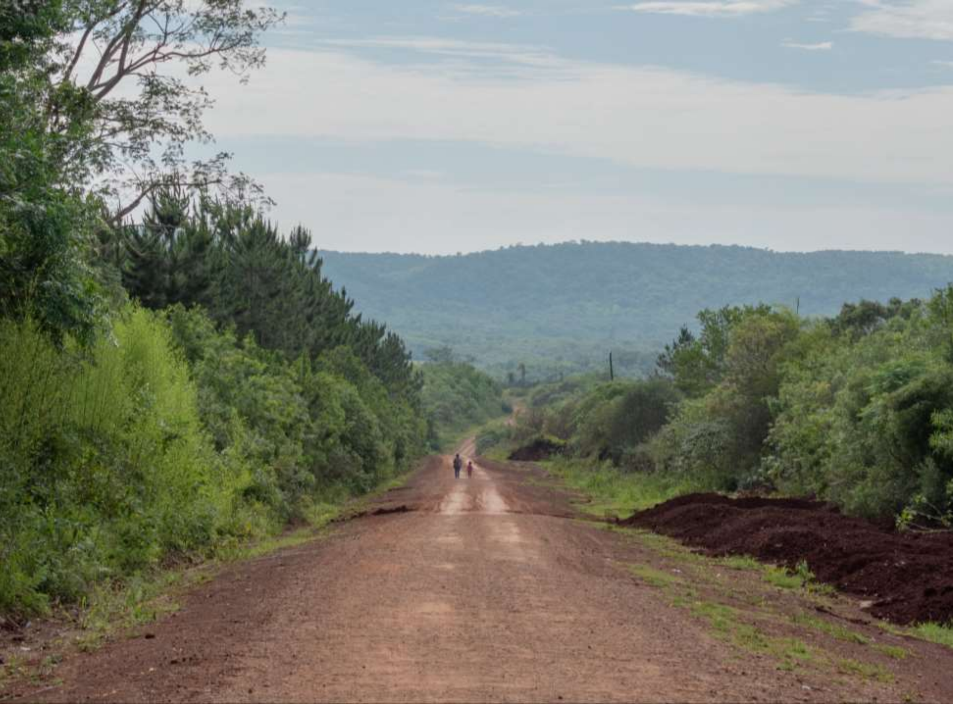
Inicio Cruce con la R.P. 4