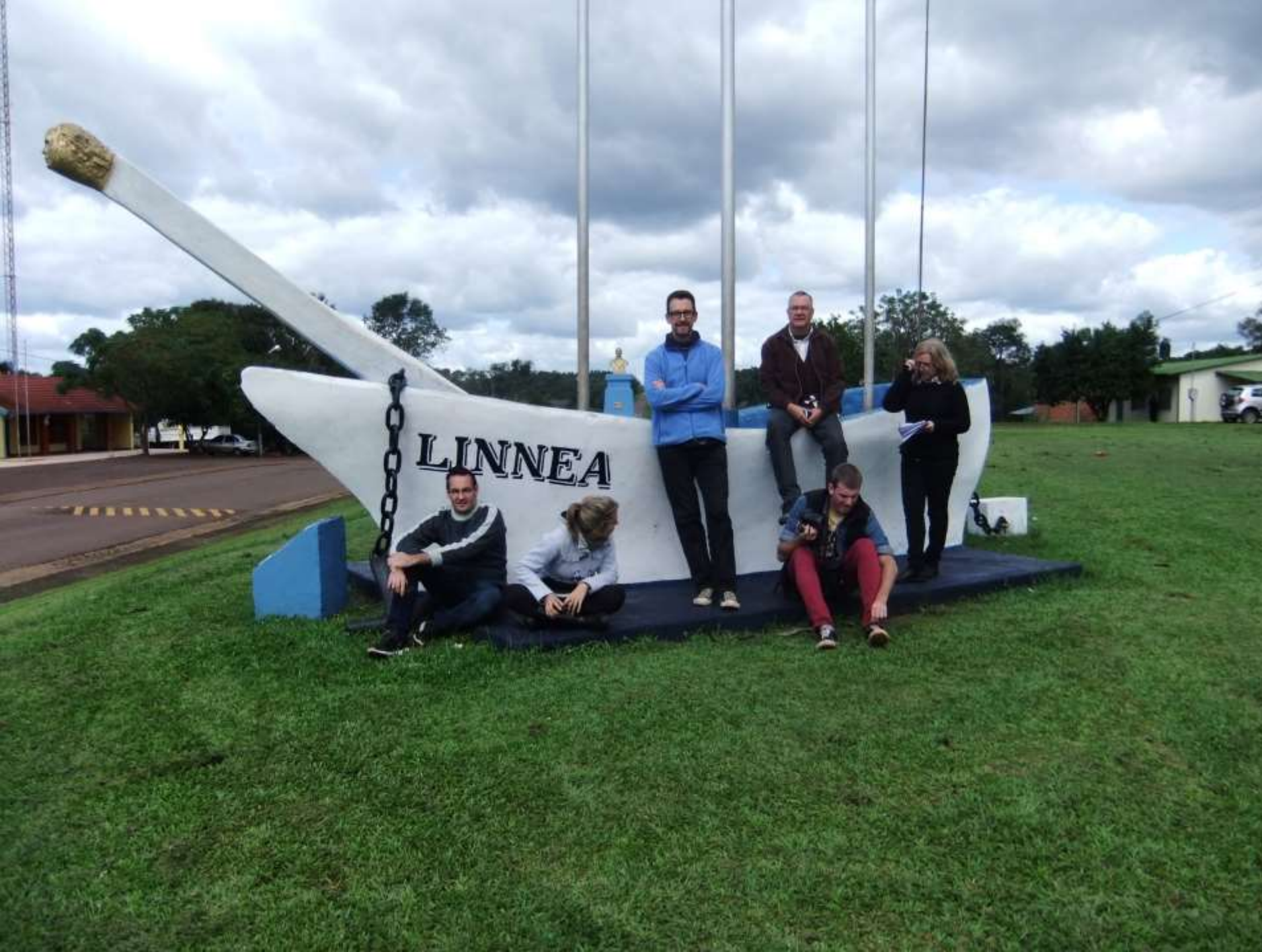
Artefacto de memoria Caá Yari