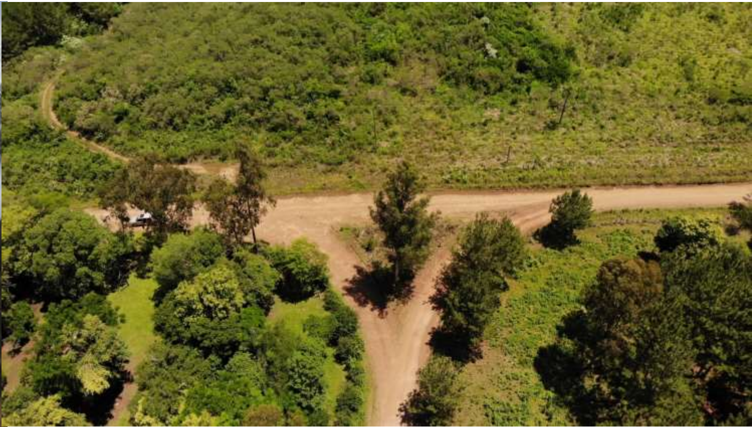
Capilla Sagrado Corazón de Jesús (Capilla quemada) Colonia Finlandesa