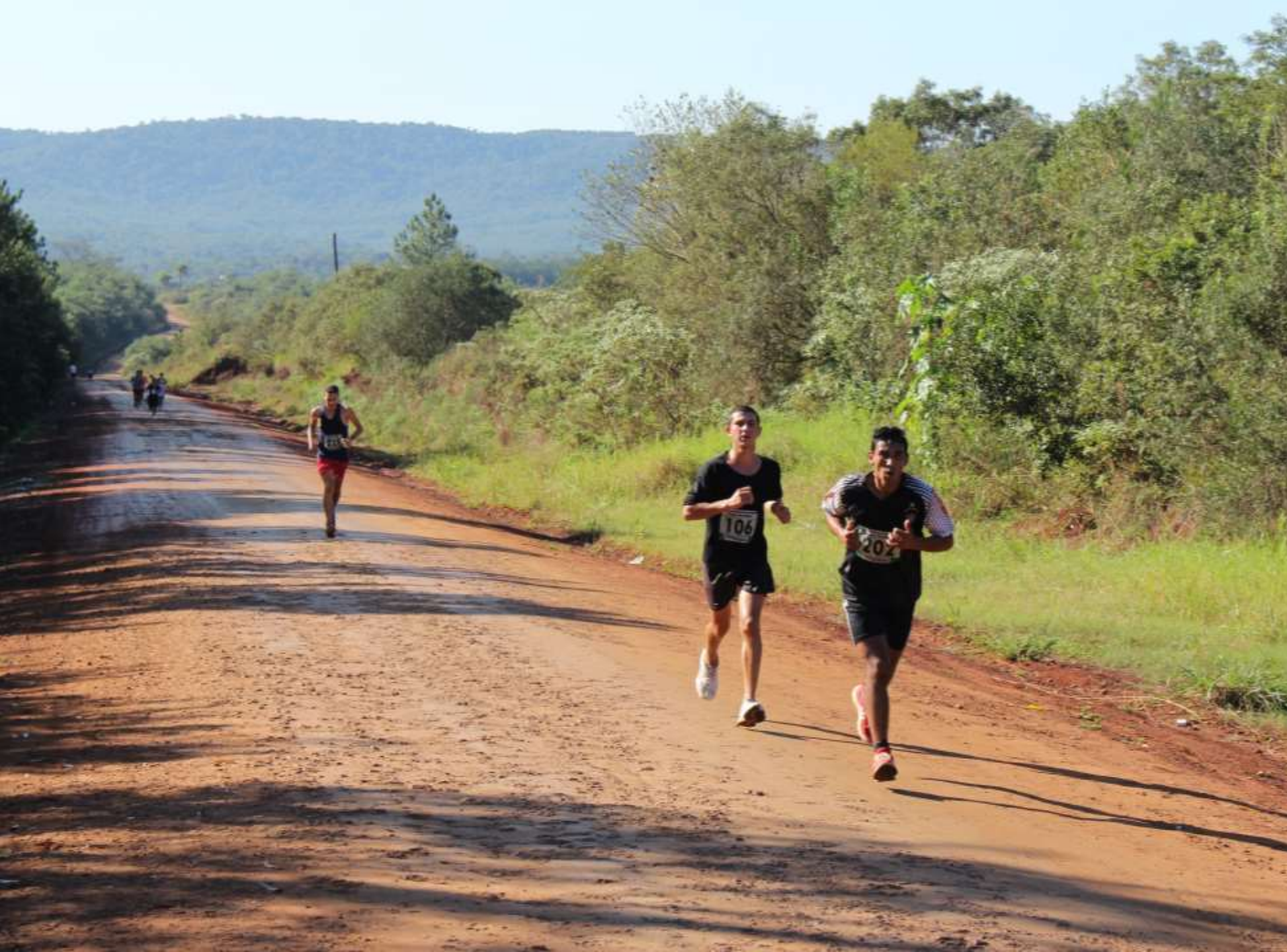
Maratón 125 a Aniversario de Bonpland