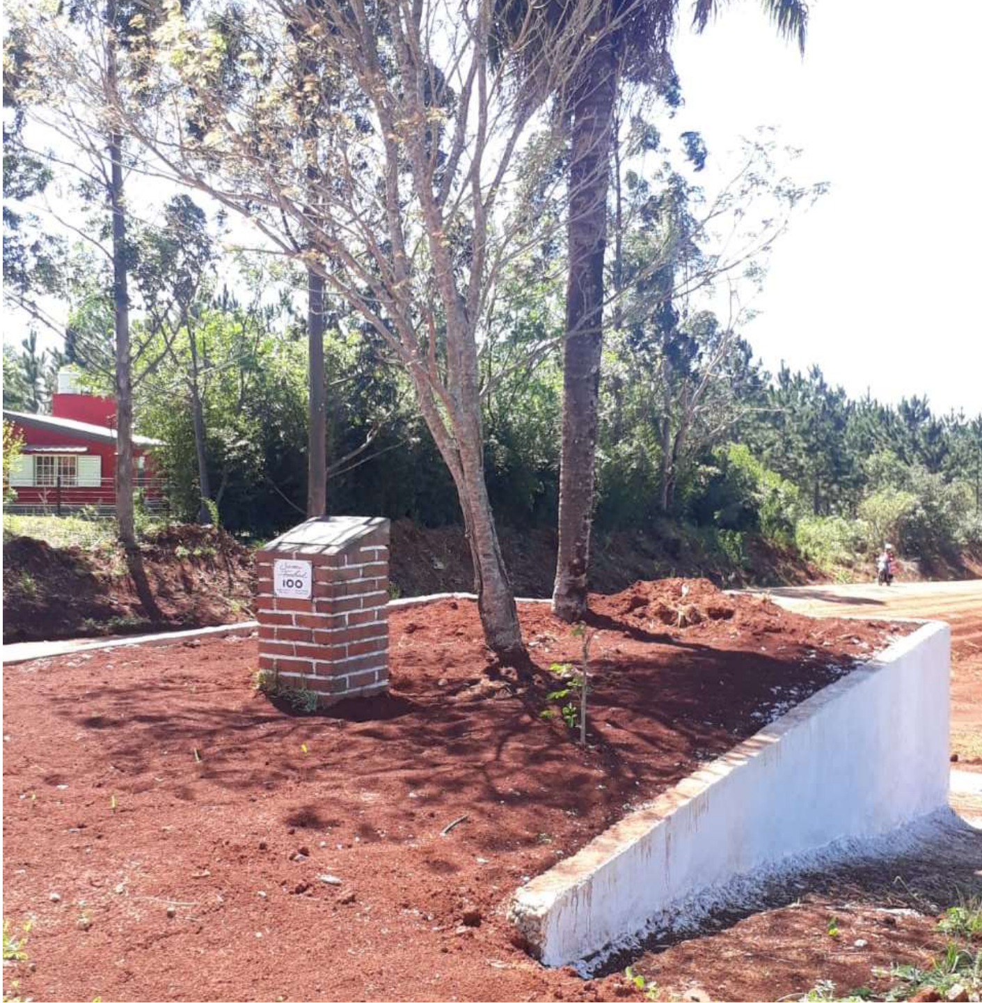
Artefacto de Memoria