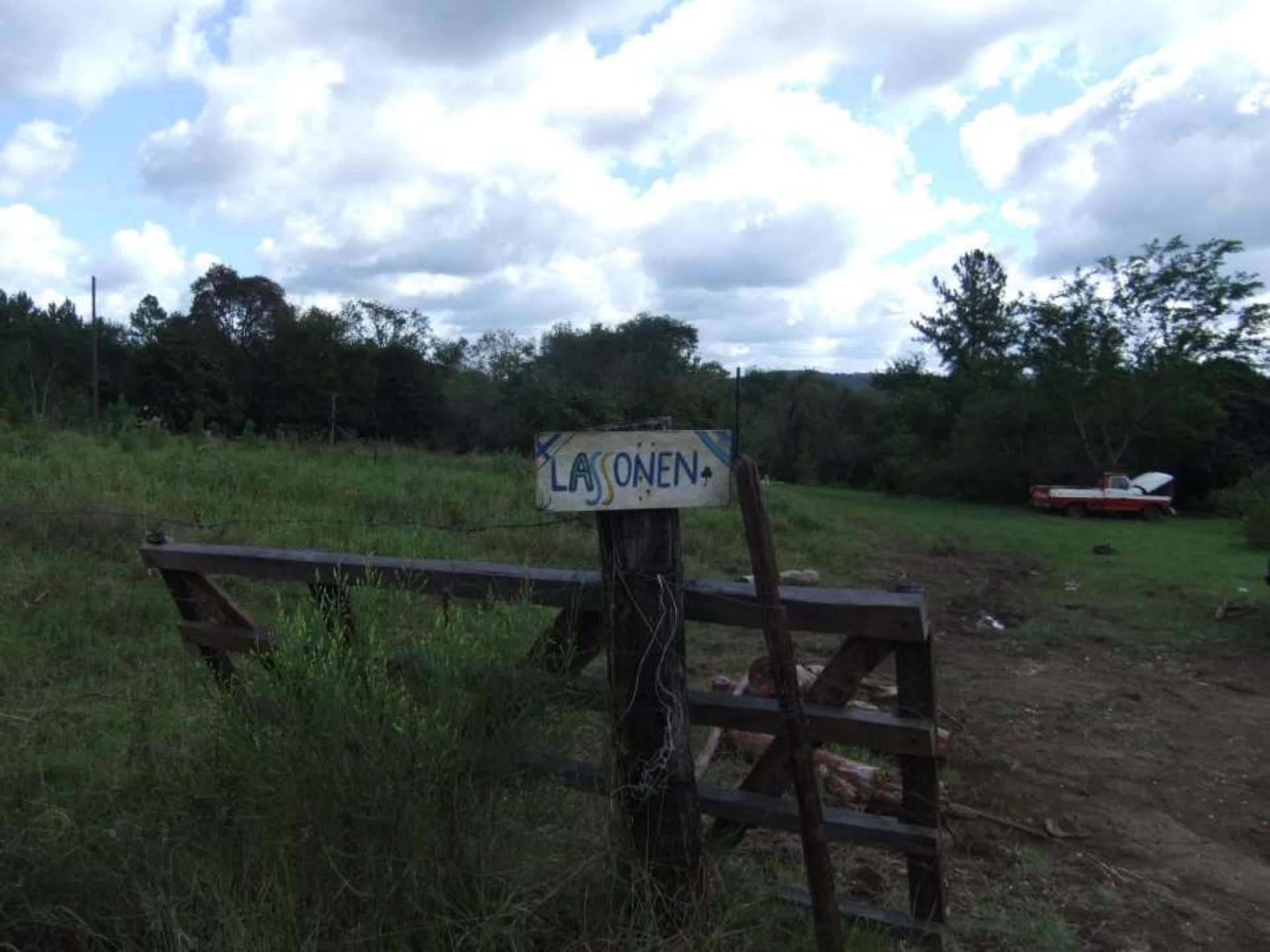
Artefacto de memoria Colonia Finlandesa