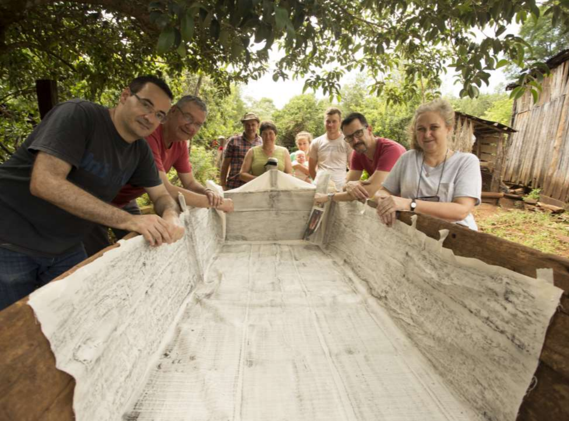
Frottage Picada Finlandesa