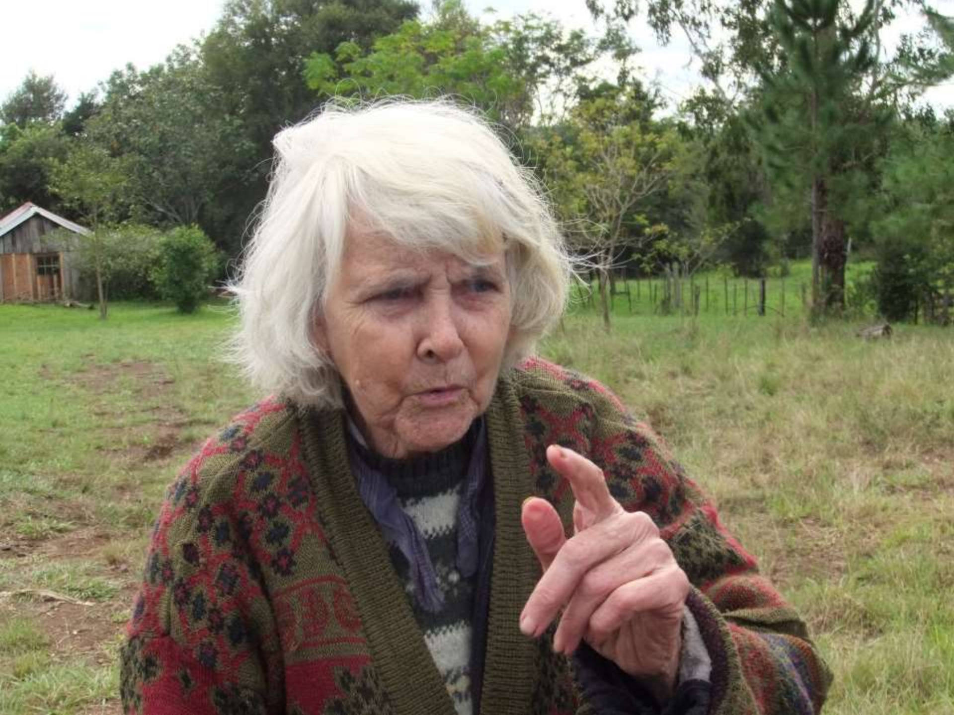
Heli Anderssen de Lementiinen Colonia Finlandesa