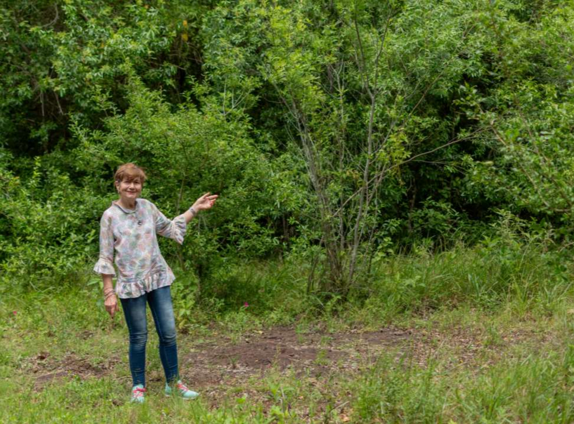
Graciela Ubicación Sociedad Finlandesa Colonia Finlandesa