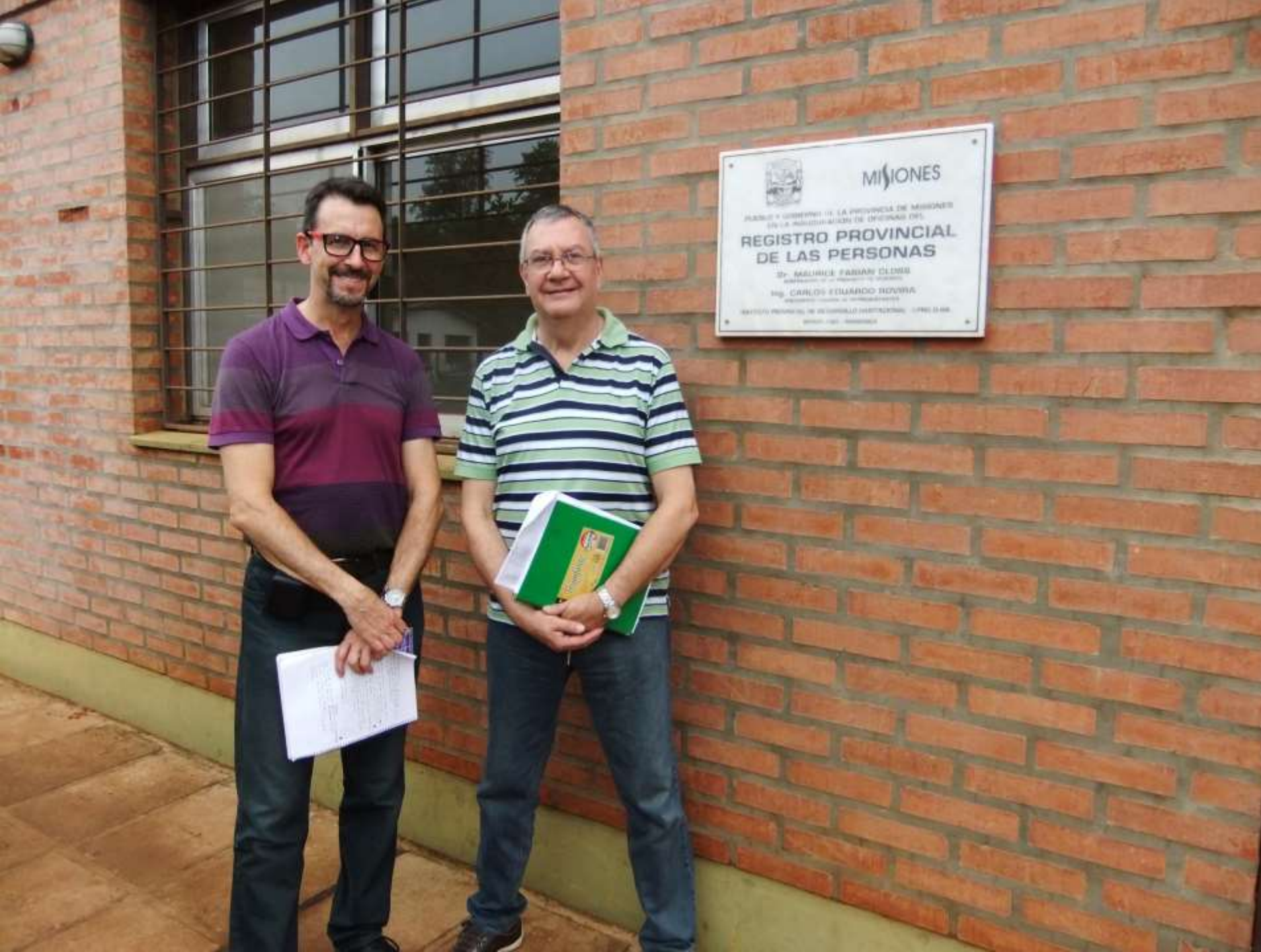
Registro Provincial de las Personas