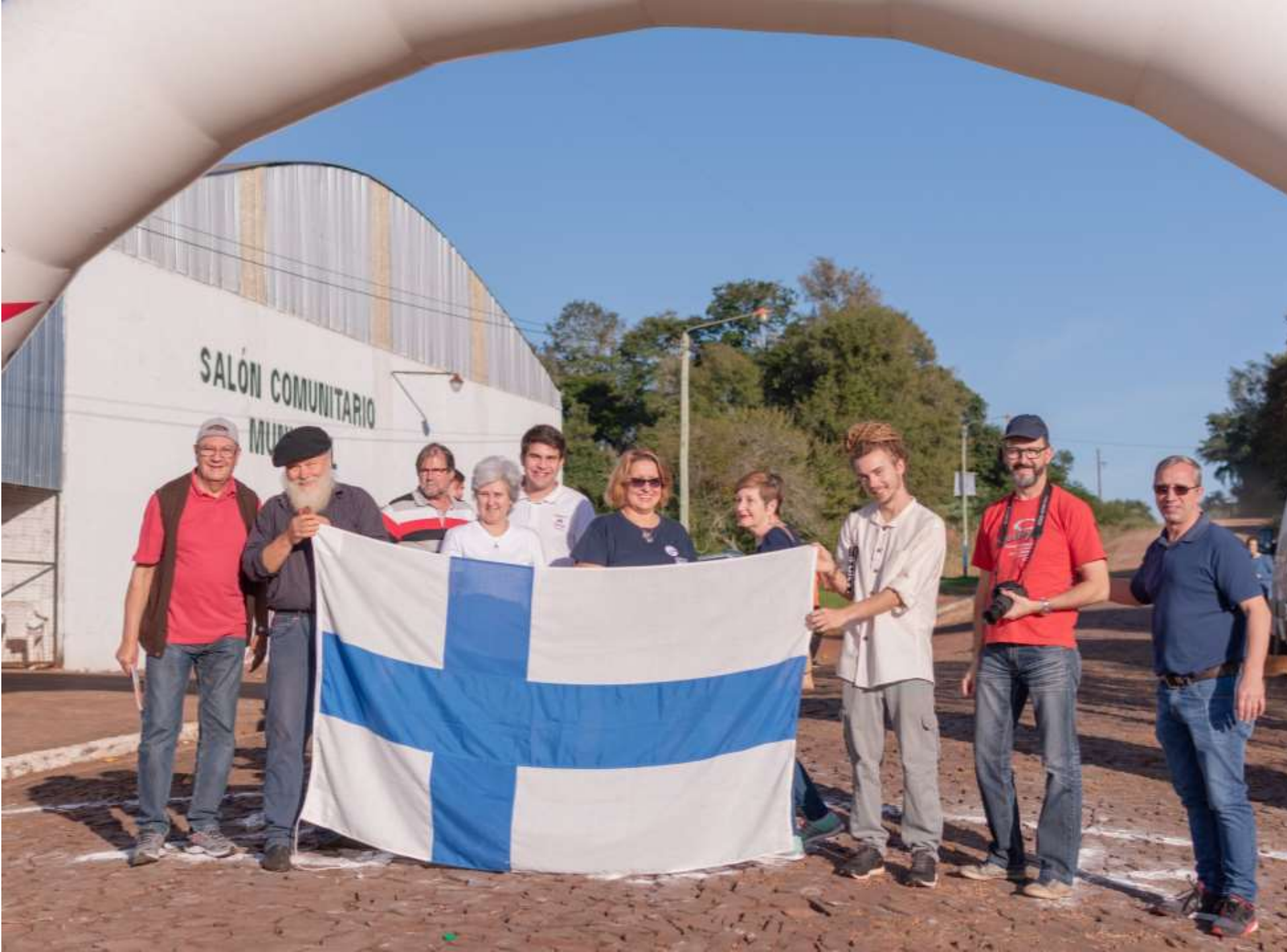
Maratón 125 a Aniversario de Bonpland Largada Caá Yará, 20k (2019)