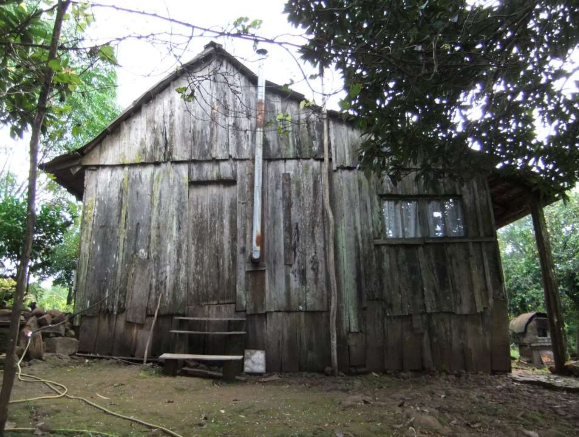
Casa familia Risten (1947) Segunda Estafeta de Correos Colonia Finlandesa