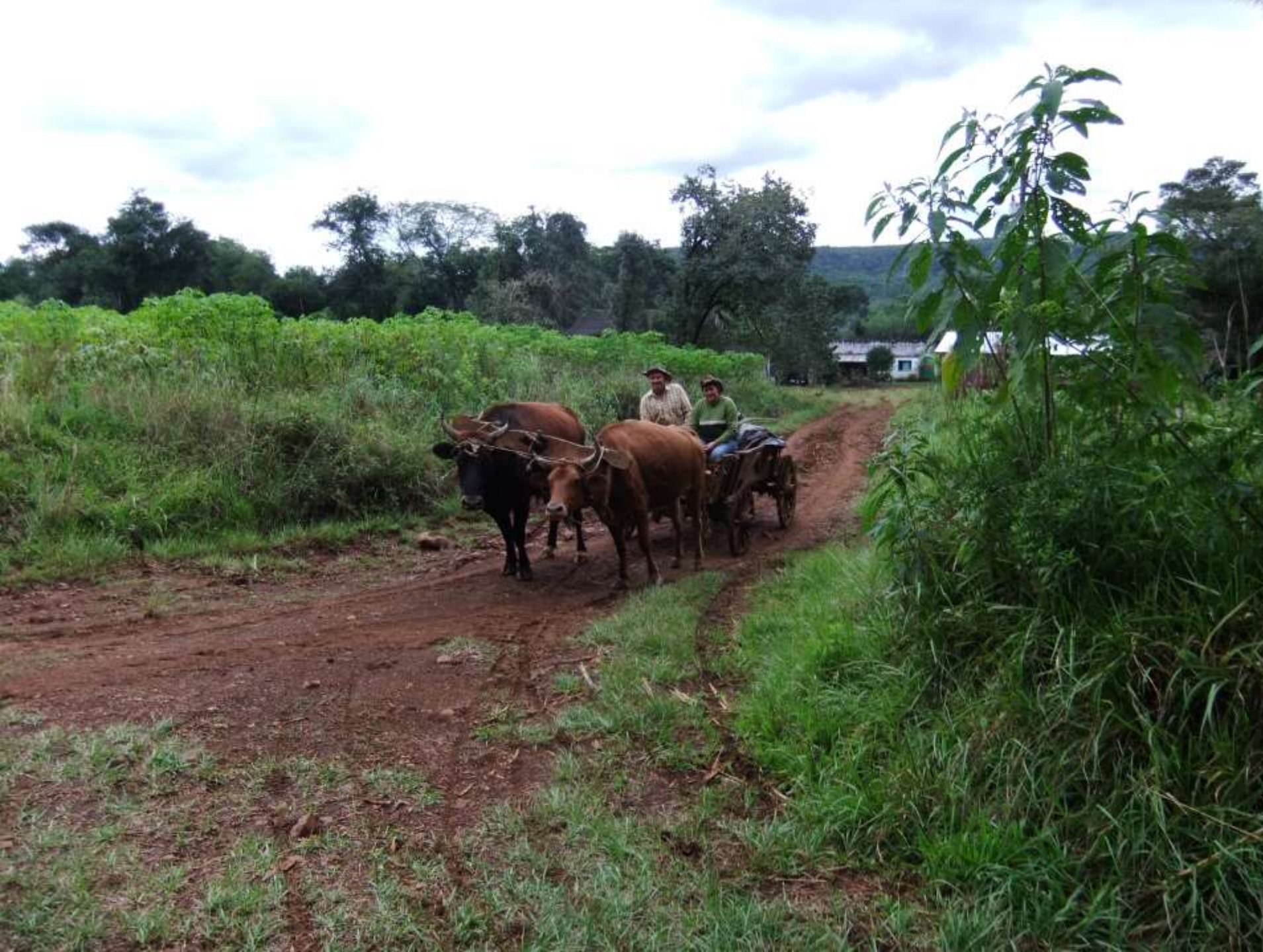
Familia Krug Picada Finlandesa