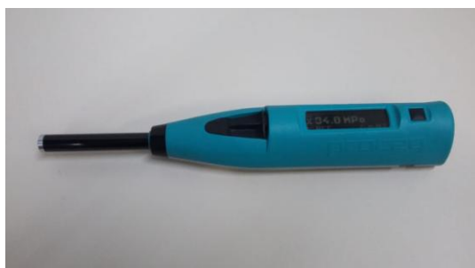
Fig.1. Esclerômetro da marca Proceq modelo SilverSchmidt

O esclerômetro utilizado para fazer os ensaios foi da marca Proceq modelo SilverSchmidt (N), com energia de impacto de 2.207 N.m, conforme apresenta a figura 1.