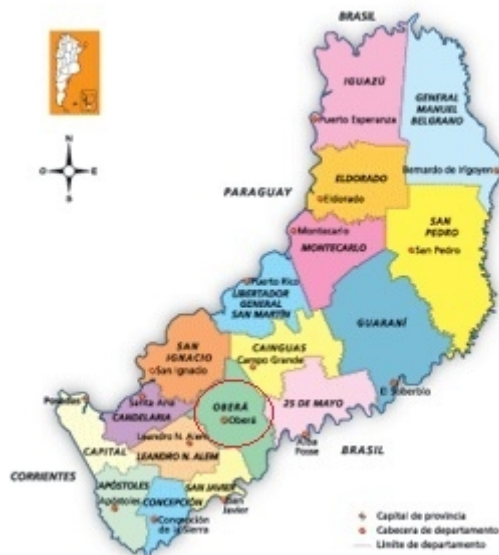
Figura 1. División política de la provincia de Misiones.

El departamento Oberá se ubica en la zona centro de la provincia de Misiones, posee una superficie de 1565 km 2 (IPEC, 2012). Limita con los departamentos San Javier, Leandro N. Alem, Candelaria, San Ignacio y 25 de Mayo; y con la República Federativa del Brasil.