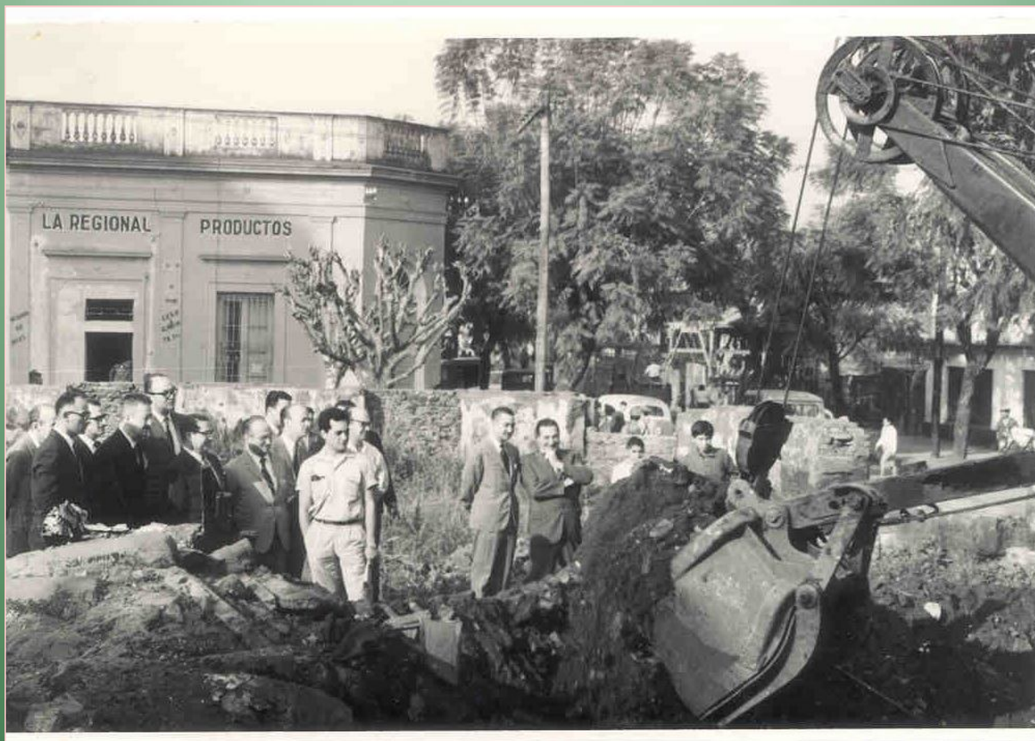
Piedra fundamental del Instituto de Previsión Social de la Provincia de Misiones.