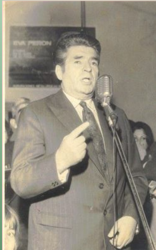
JUAN MANUEL IRRAZÁBAL 4° Gobernador electo de la Provincia de Misiones 25/05/1973 al 30/11/1973