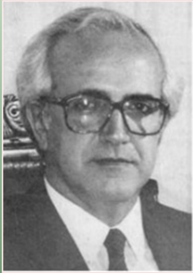
RICARDO BARRIOS ARRECHEA 6° Gobernador Electo de la Provincia de Misiones 10/12/1983 al 17/09/87