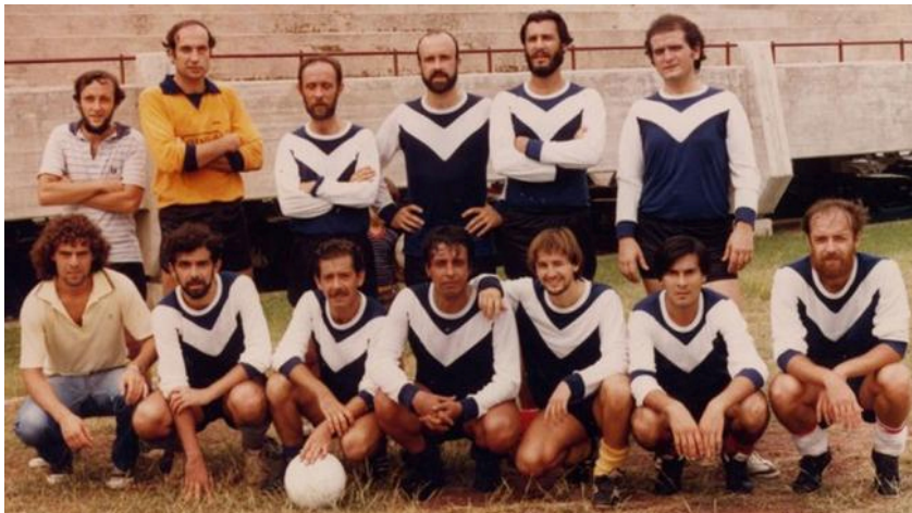
F9. Equipo de fútbol de Tonos y Toneles.

Los muchachos de Tonos y Toneles también jugaban al fútbol, tenían un equipo del boliche , un horario y día semanal. Los sábados por la tarde, artistas, públicos y personal de apoyo salían a la cancha a transpirar la camiseta.