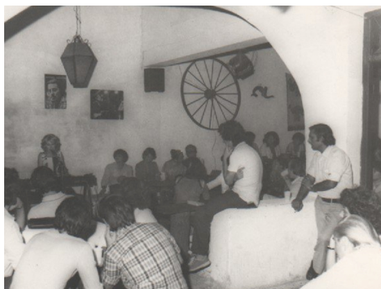
F5. Fotografía interior de Tonos y Toneles.

El lugar estaba poblado de mesas, con mantel de hule o de papel. Para sentarse estaban los barriles, es decir los toneles. El vino, de 'damajuana' y de poca calidad, se servía en vasos de plástico, y dada la precariedad de esas mesas y sillas había que tener precauciones para no voltearlos. Para comer la única opción era empanadas hechas por los dueños del local y, avanzados los años las compradas en otro lado. Según varios testimonios, éstas no escatimaban en grasa. Fuera del local, Tonos tenía su propio cuidador de autos, un hombre que habitaba una de las villas miserias cercanas al local, que debía movilizarse con muletas por un accidente que le había llevado a perder una de sus piernas.