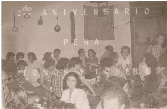
F3. Interior de Tonos y Toneles.

ISSN: 1515-2413 (impreso); 1851-1694 (on-line) 000