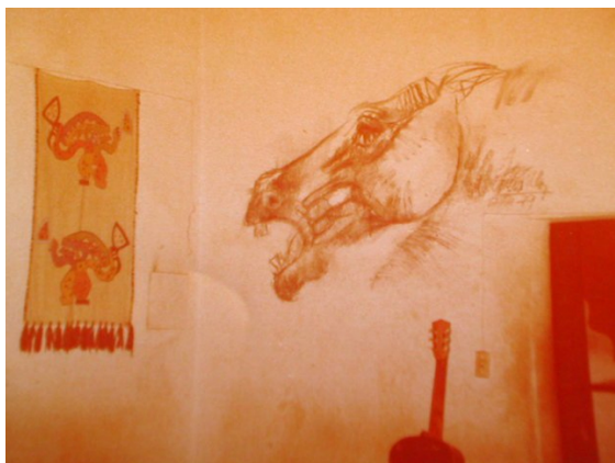
F4. Interior de Tonos y Toneles, caballo dibujado por Moreno Ulloa sobre una de las paredes del local.

El lugar estaba poblado de mesas, con mantel de hule o de papel. Para sentarse estaban los barriles, es decir los toneles. El vino, de 'damajuana' y de poca calidad, se servía en vasos de plástico, y dada la precariedad de esas mesas y sillas había que tener precauciones para no voltearlos. Para comer la única opción era empanadas hechas por los dueños del local y, avanzados los años las compradas en otro lado. Según varios testimonios, éstas no escatimaban en grasa. Fuera del local, Tonos tenía su propio cuidador de autos, un hombre que habitaba una de las villas miserias cercanas al local, que debía movilizarse con muletas por un accidente que le había llevado a perder una de sus piernas.