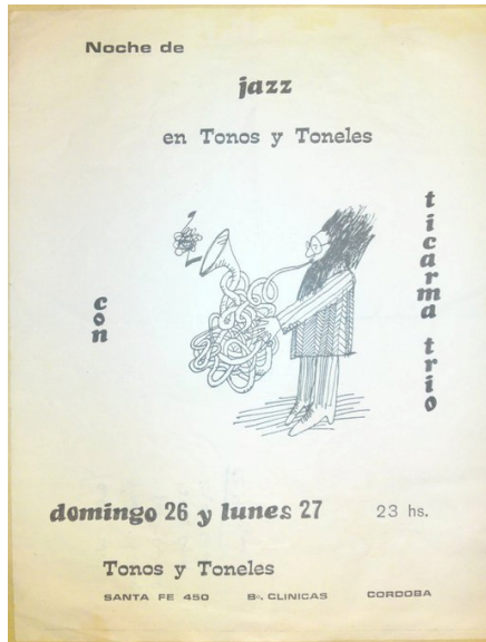
F6. Folleto difusión.

A partir de estos datos empíricos podemos observar que las carteleras sonoras de Tonos no se definían meramente por un criterio estilístico. Detectamos que en el local comercial se presentaron conjuntos de folklore, rock y jazz. Lo distintivo más bien estaría dado por una especie de frontera moral que diferenciaría ciertos circuitos juveniles entre ellos. En la peña que abordamos aquí, las sonoridades que podían ser admitidas debían cumplir ciertos estándares de calidad y contenido . Ciertas sonoridades eran consideradas ‘buenas’ o ‘malas’, por lo cual estos jóvenes construían una frontera ideológica y emocional a partir de una distinción cultural específica (Fassin, 2008). Con el término calidad se calificaba a ciertas sonoridades que incluían armonías y arreglos musicales complejos que demandaban cierta maestría en la ejecución de los instrumentos musicales, letras de contenido social y político de tono crítico, el cultivo de una poética que excluía la rima consonante, las metáforas previsibles y las referencias picarescas.