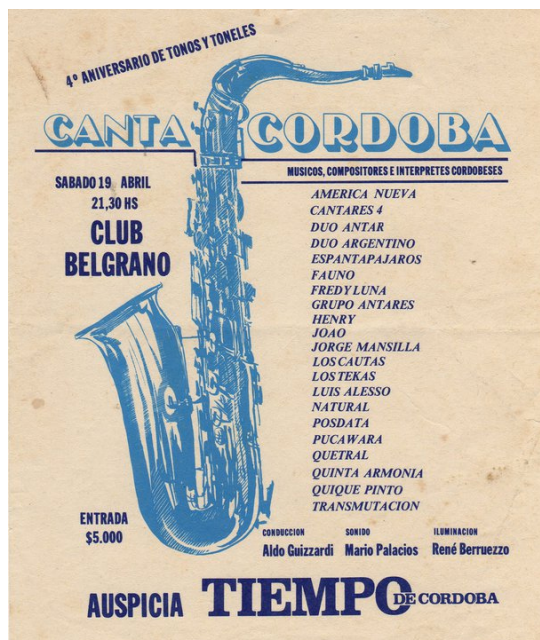
F8. Folleto difusión aniversario.