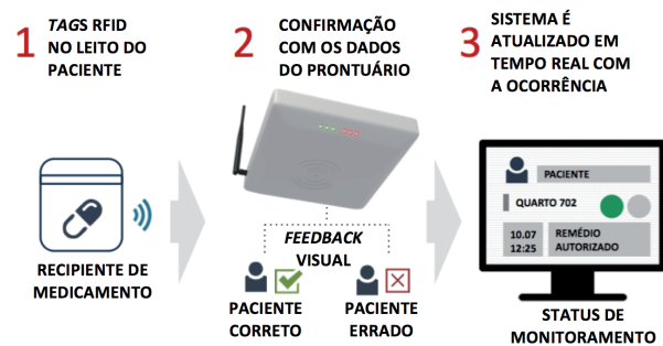
Figura 3: Processo interativo de monitoramento RFID

Dessa forma, pretende-se auxiliar os profissionais no cumprimento exato de cada medicação do paciente, realizando a confirmação eletrônica do que está prescrito no prontuário. Caso a medicação enviada ao leito do paciente não seja a mesma prescrita em seu prontuário, a própria antena RFID emitirá alerta visual no quarto e o sistema é atualizado em tempo real na enfermaria (Figura 3), buscando evitar o erro antes de ocorrer. Com isso, pode-se evitar ainda que, mesmo que o recipiente de remédios esteja de acordo com o prontuário, seja enviado em horário errado.