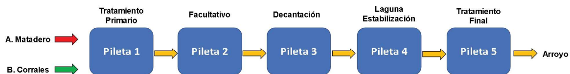
FIGURA 1 – Esquema de funcionamiento de la Planta de Tratamiento de Efluentes

El efluente extraído de la pileta 2 se traslada por diferencia de nivel hasta la pileta de sedimentación (Pileta 3), compuesta por 2 módulos que funcionan en paralelo. A la salida de esta pileta, el efluente pasa por una cámara de inspección e ingresa a la laguna (Pileta 4), para luego pasar nuevamente por dos cámaras de inspección, las cuales poseen unos filtros compuestos por piedras y ladrillos huecos. Finalmente ingresa a la Pileta 5, compuesta por tres módulos independientes, en el último de los cuales, se hace un agregado de cloro a fin de eliminar bacterias y descargar el efluente hacia un canal que conduce a un arroyo.