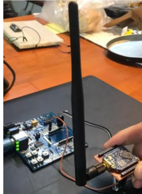
Imagen 2. Prototipo V1 de transceptor 2