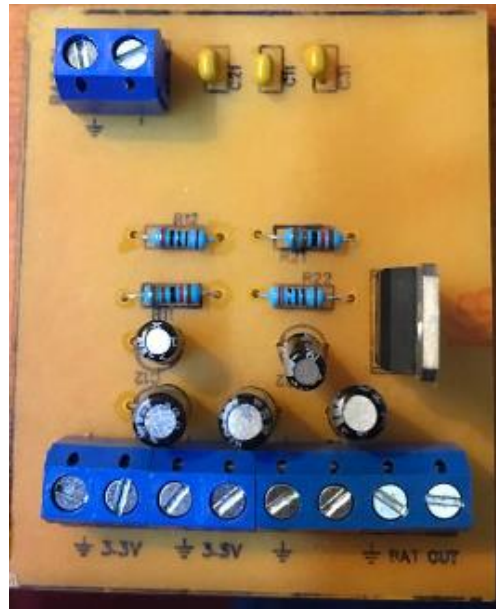
Imagen 5. Fuente de alimentación V1 para prototipos v1.2.