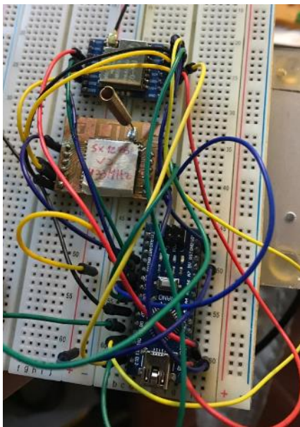
Imagen 3. Prototipo V1.1 de transceptor 1.