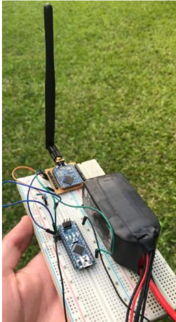
Imagen 1. Prototipo V1 de transceptor 1