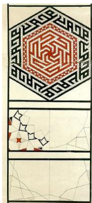
Figura 3. Exemplo Muqarna

2012). Por isso uma representação das imagens, uma sua réplica, não tinha algum sentido. A produção de imagens estava reduzida à reprodução de padrões e superfícies provenientes do mundo matemático, o qual não tem uma contrapartida empírica visual. O cálculo geométrico levava à produção de superfícies organizadas que não eram simplesmente decorações ou enfeites artesanais sem algum significado. Pelo contrário, se tratava de uma forma simbólica assim como o era a perspectiva na Europa. Aliás, estas produções eram consideradas em Ocidente como abstratas , pois não se conseguia perceber a sua ligação com a realidade. Eram consideradas como arte decorativo, o polo oposto da arte pictórica ( pictorial ) que passaria a ser sinônimo da arte em geral (Belting, 2012), o que demonstra a capacidade de determinação do frame ocidental.