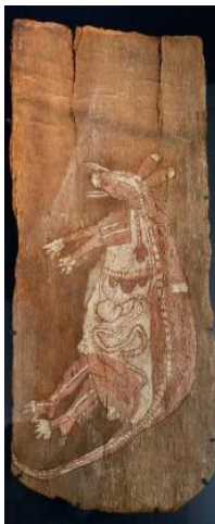
Figura 1. Canguru totêmico ancestral. Alligator River, Arnhem Land. Noni, Australia.

desta ontologia, concentra-se no ato de mostrar a identidade essencial e material dos membros humanos e não-humanos pertencentes a uma classe totêmica. Na qual todos compartilham o mesmo protótipo originário que lhes confere princípios de individualização e uma identidade física, pois são feitos da mesma matéria (Descola, 2010a). Assim, nesta arte, o que é possível ver é o registro dos indícios provenientes do tempo do Sonho, no qual se dá a gênese ontológica de uma filiação, indícios que se concentram numa narração de caráter cartográfico.