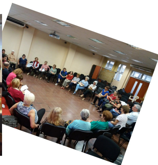
Fig. 5: Trabajo y alegría en grupo.