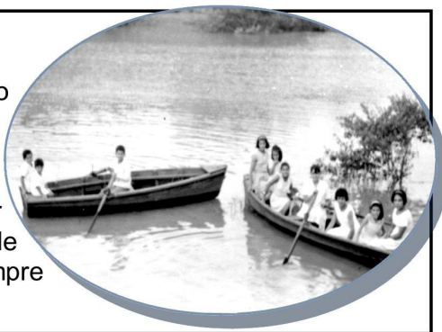
Fig. 1: Paseo en canoas Puerto Piray. Año 1960