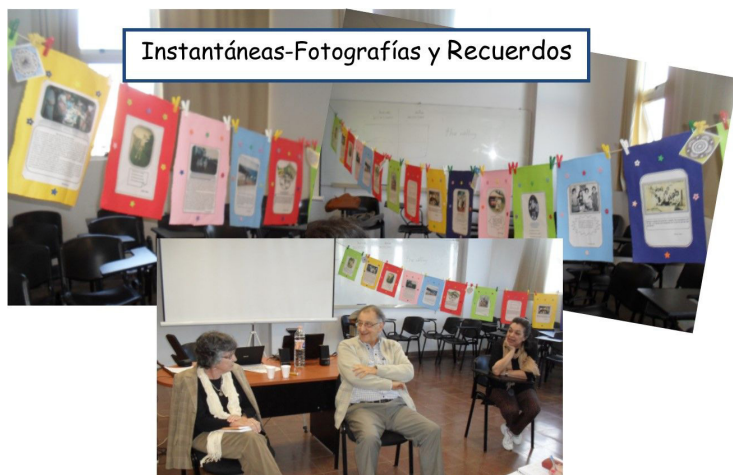
Fig. 3: Visita de escritores. Galería de instantáneas.

Ya en el 2015 habíamos aceptado el desafío - a pedido de lo/as Abuelo/as- de producir un guion dramático que diera cuenta de los temas, los problemas, los intereses y sobre todo el humor del mundo de los adultos mayores. Luego de dos jornadas de trabajo con improvisaciones, escribimos el guion, que fue revisado, corregido y finalmente, puesto en escena en la modalidad de teatro leído el día 20 de noviembre en el cierre de los talleres UPAMI. La experiencia nos permitió hacer de la construcción colectiva un verdadero hecho artístico, que como tal, no soslaya la puesta en escena de los