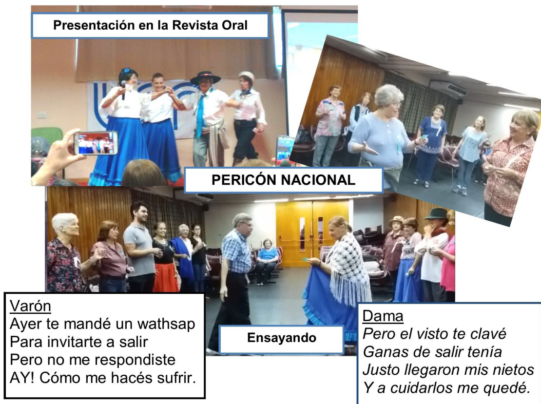
Fig. 4: Ensayos

La obra consta de tres escenas que van mostrando a los adultos mayores en acción: charlas en la vereda, club de abuelos, peripicias en el sanatorio, fiesta, viajes, amores. El cierre del año con la muestra de lo realizado se transformó en una buena oportunidad para compartir los logros del año con amigos y familiares que colmaron la capacidad del SUM de Humanidades.