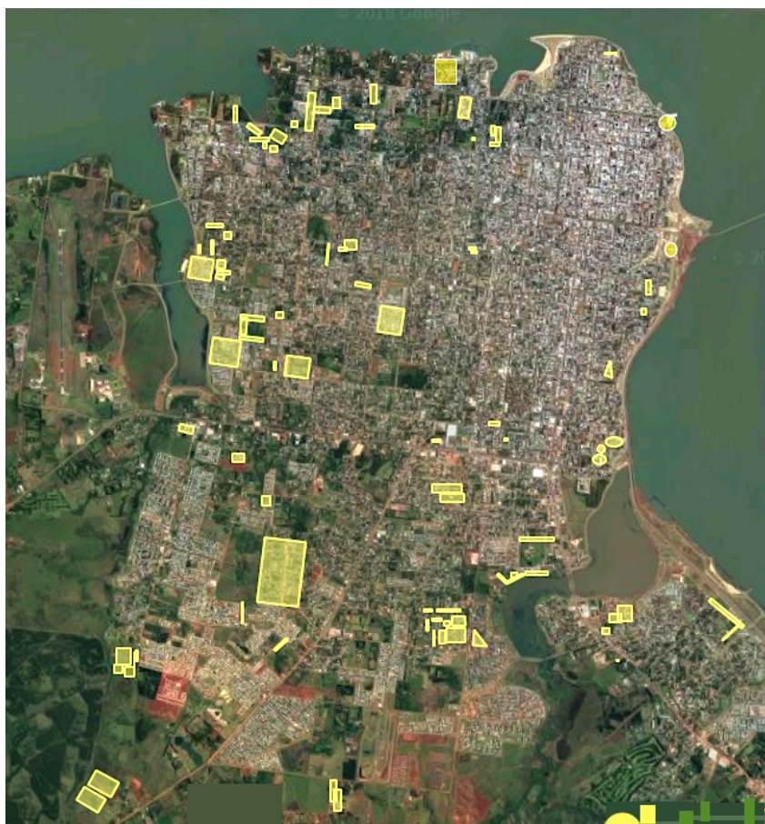
Figura 1. Ciudad de Posadas y localización de los asentamientos.

La problemática del acceso a la tierra y a la vivienda pone de relieve el fenómeno de la pobreza y la desigualdad sociourbana, así como la escasez y/o improvisación de políticas que la aborden con éxito. Desde el plano gubernamental y desde los medios de comunicación acaparan más la atención los conflictos suscitados muchas veces por la posesión del suelo, que por las condiciones de vida de la población que habita en asentamientos precarios o informales.