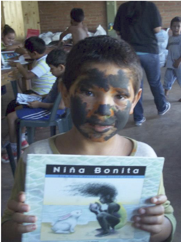
Fotografía del Taller de Lectura "Libro Álbum"- Club de Lectura Comunitaria en San Isidro, Posadas, Misiones

las tradiciones del juego y del nonsense, lo que coloca a esta producción a gran distancia de aquellos modos del tutelaje. (p. 11)