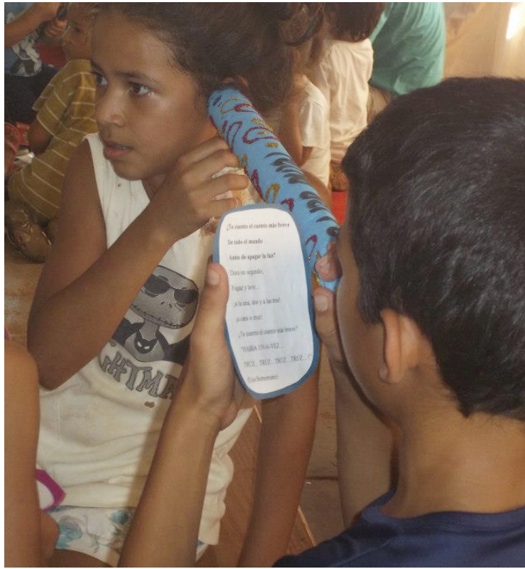
Juegos con los textos, en el taller

Desde el CeMILLIJ se concluye que en los