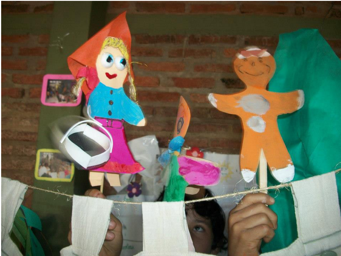
Función de títeres

En esa ocasión pudimos observar que paulatinamente los niños no sólo habían incorporado el hábito de la lectura sino que se habían apropiado del espacio y de los libros por lo cual con gran autonomía recomendaban, comentaban o criticaban las obras a sus madres.