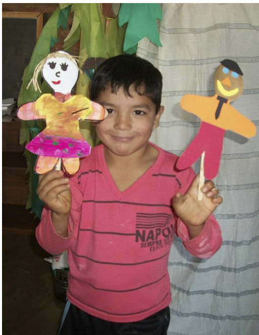
Fotografía del “Taller de Títeres” - Club de Lectura Comunitaria en San Isidro, Posadas, Misiones.

En este taller trabajamos con la lectura del cuento: “Árbol de sombreros”, de Maria Elena Walsh e iniciamos la lectura con una pregunta general: ¿Qué tipos de árboles conocen? Las primeras respuestas