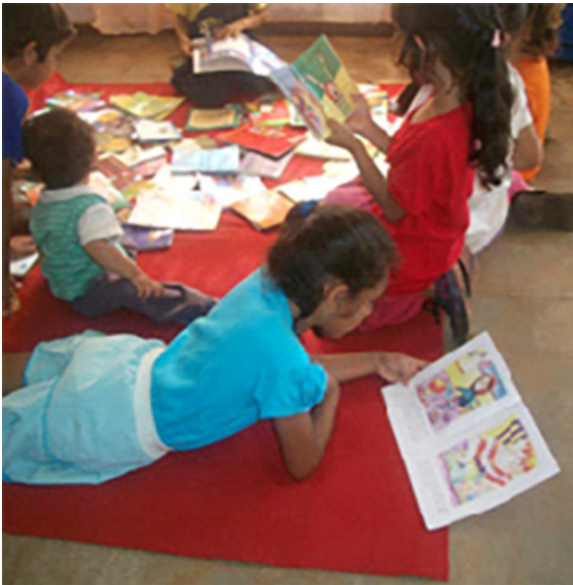
Fotografía del Taller de Lectura "Libro Album"- Club de Lectura Comunitaria en San Isidro, Posadas, Misiones

pobladores recuperar un espacio y uso de la voz. Ella comenta cómo a través de los relatos va construyendo nuevos vínculos y redes que ayudan a que los sujetos en situaciones vulnerables ya no se sientan aislados, sino parte y partícipes de una cultura universal. Tomando esta idea, semana a semana, fuimos trabajando en talleres de lectura y escritura que nos permitieran recuperar la voz y la experiencia del otro que -por vergüenza o por temor- calla, o insulta o incluso golpea intentando llamar la atención.