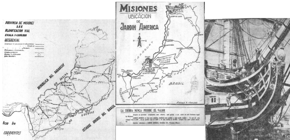
Mundo Misionero (1962)

oportunamente, estaban distribuidas por casi todo el Territorio: “... Aeródromos: en Posadas y Puerto Iguazú. Se hallan en buen estado. Pistas de aterrizaje: en Apóstoles, Bonpland, San Javier, San Ignacio, Eldorado, Leandro N. Alem, Montecarlo, Puerto Bemberg, Puerto Gisela, Piray, Puerto Esperanza, Puerto Rico, Oberá y Santo Pipó, en buen estado; y en San José, Alba Posse y Campo Viera, en mal estado. Pistas de aterrizaje en construcción: en Concepción de la Sierra, Corpus y Bernardo de Irigoyen” (AGGM, 1947), sin embargo, para 1950, se consideraba que extensas zonas del Alto Paraná y Alto Uruguay, constituían “areas intensamente ricas y totalmente inexploradas...”(AGGM, 1949)