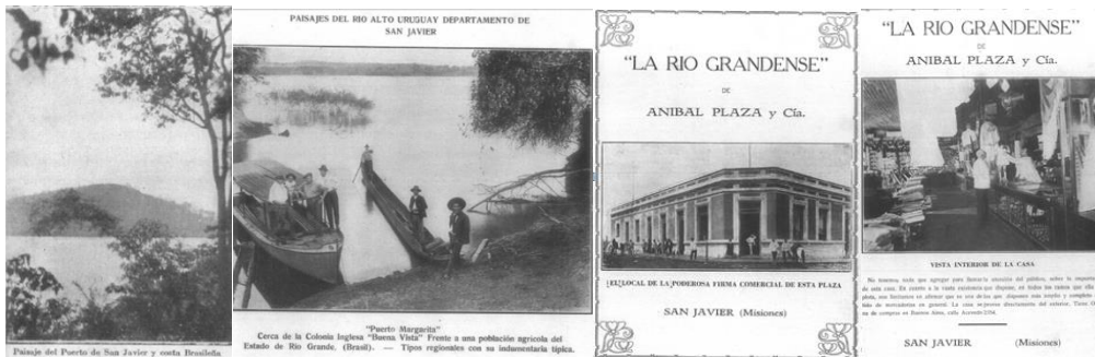
Guía General de Misiones (1923)