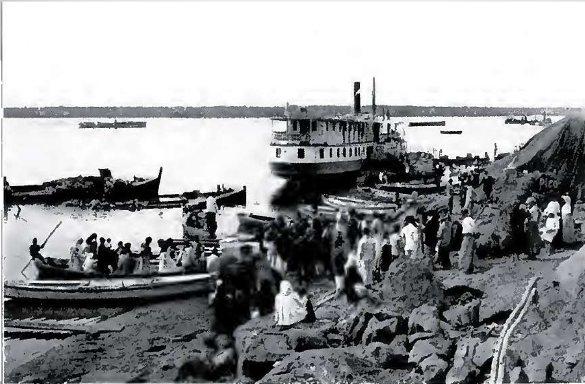
ON THE UPPER PARANÁ