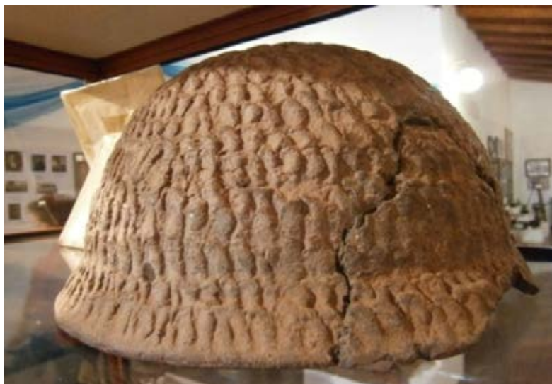
Pieza arqueológica de cerámica guaraní espatulada, Parque las Naciones, Oberá, Misiones.

La propuesta surgió como necesidad de socializar conocimientos en relación con la cerámica arqueológica de tradición tupí guaraní, que se desarrolló en la denominada región de las Misiones. Con respecto a esta temática, los textos existentes abordan cerámica precolombina de América en general y del Noroeste argentino en particular, siendo escasa la bibliografía referida a la producción cerámica de los Guaraníes. El desafío es aportar material de estudio específico en nuestro idioma, respetando la fonética de la lengua guaraní, utilizando medios audiovisuales.