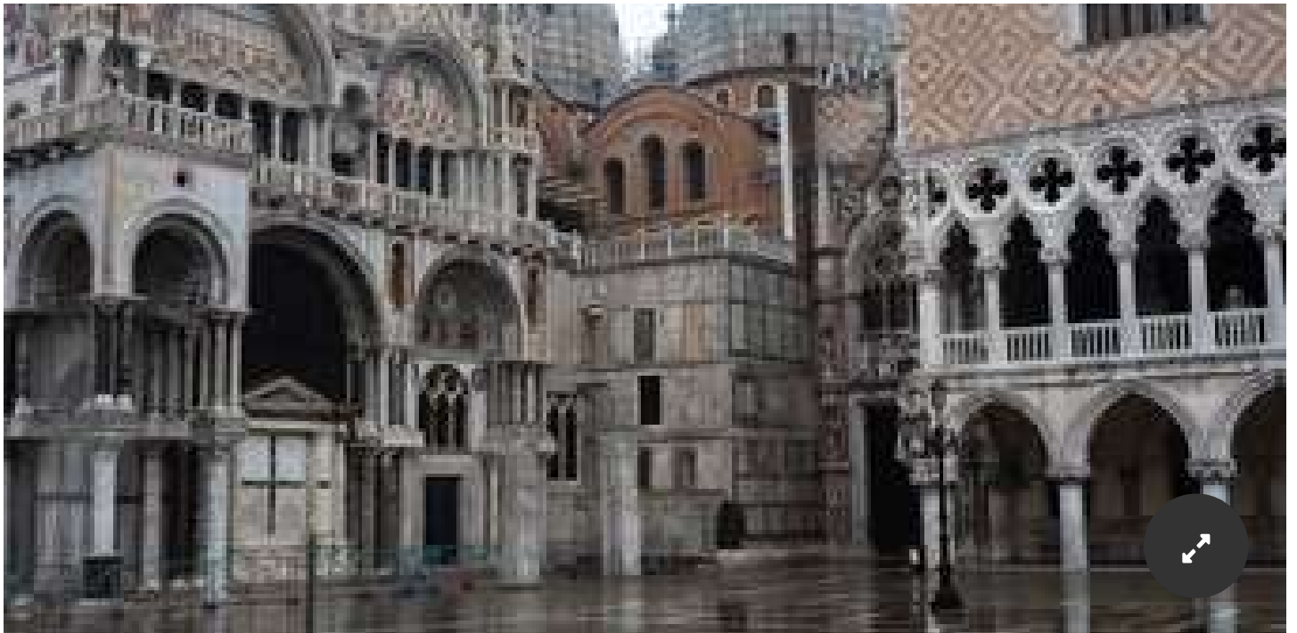
Venecia desierta en febrero, con el carnaval cancelado por el Covid-19.

Una especialista propone diseñar planes de restauración y mantenimiento aprovechando la escasez de visitantes en sitios patrimoniales.