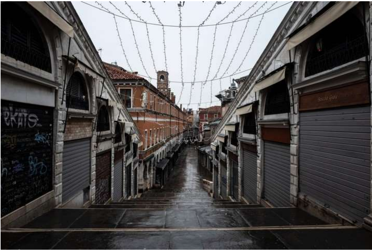
Negocios con persianas bajas en el puente de Rialto, Venecia.

Uno de los peores impactos que sufren los bienes es el estar deshabitados por largos períodos , porque no son sostenidos sistemáticamente y su deterioro se esconde tras un mínimo mantenimiento para la temporada. En eso están poblaciones fantasmas o cuasi, como Venecia por ejemplo, que ha sido uno de los destinos estrella durante tantos años, ahora habitada establemente sólo por un tercio de la población , que se debate en un interminable y contaminante remate de propiedades que otrora alojaban a familias y hoy en el mejor de los casos, son sede de entidades de bien público o cultural.