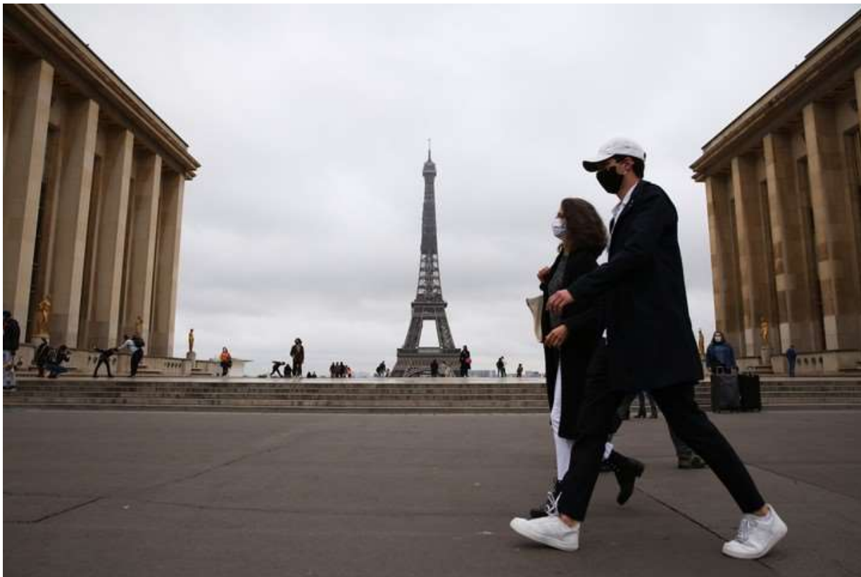
Pocos visitantes en el Palacio del Trocadero, París.

Habitualmente, el turista sólo se pregunta acerca del alojamiento y gastronomía, los precios de las actividades, y otras dudas simples que tienen que ver generalmente con su estancia en la ciudad de destino. Jamás se preocupa por la condición de los bienes patrimoniales , ya que descuenta que su estado de conservación será óptimo para desarrollar el paseo.