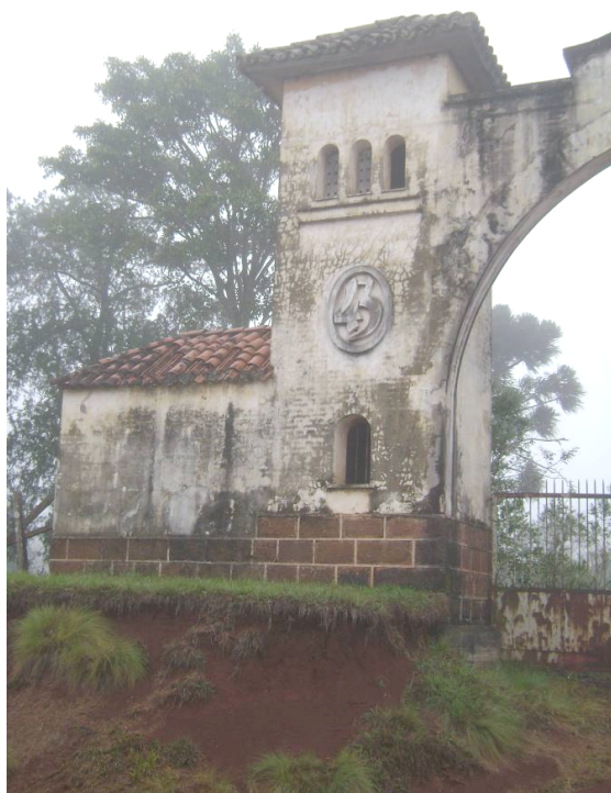
Vista parcial de la entrada a las antiguas instalaciones de acopio de Piccardo y Cia. Santa María, Misiones.