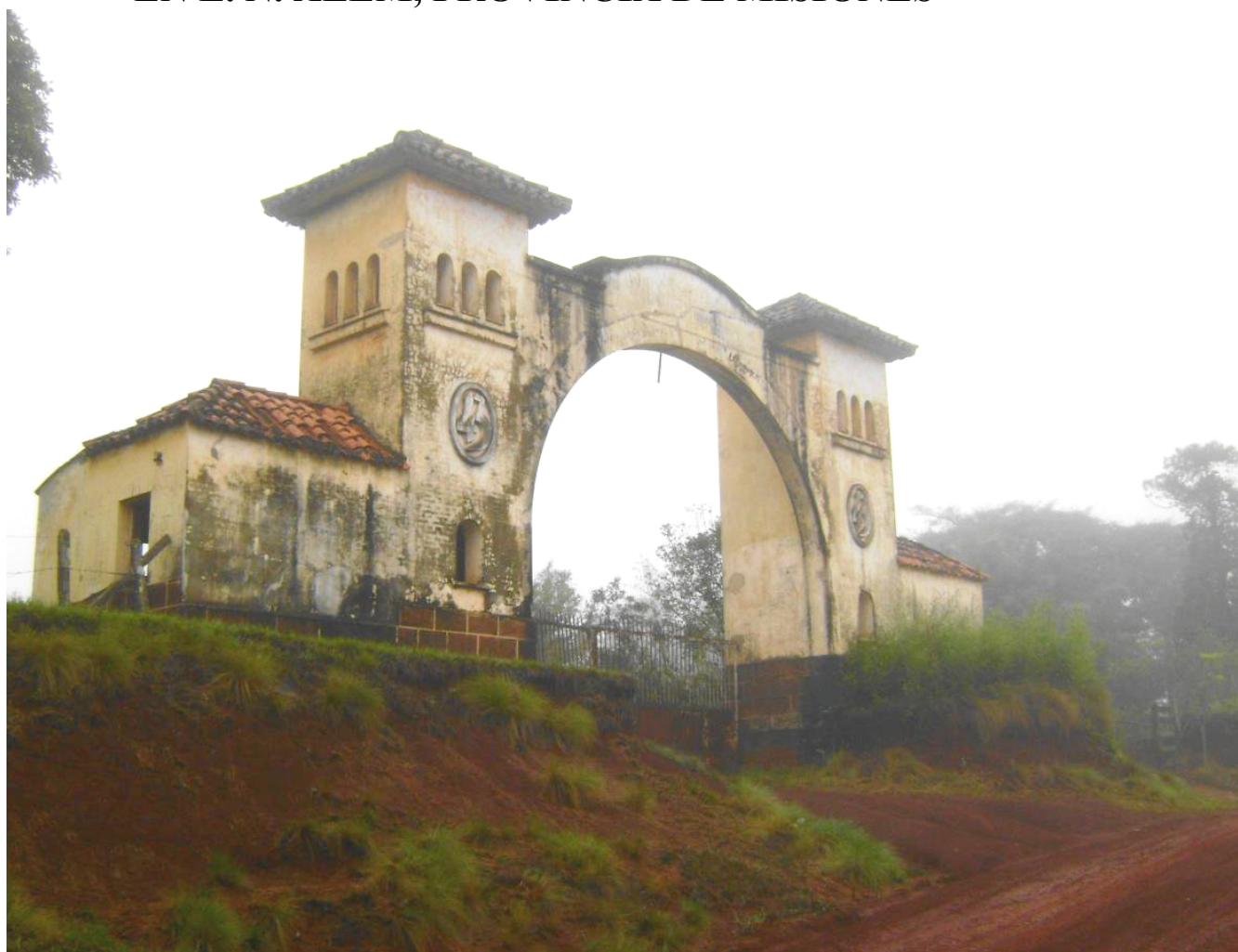
Vista actual de la entrada a las antiguas instalaciones de Piccardo y Cia. Santa María, Misiones.