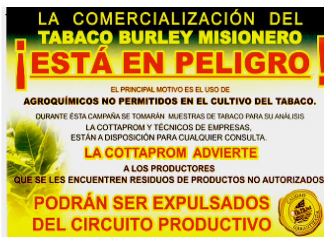
Afiche contemporáneo, elaborado por la CoTTaProM y distribuido a los productores por las Empresas y la Dirección de Tabaco.

Las plagas se controlan, únicamente , con los agroquímicos entregados por los técnicos de las empresas, quienes exigen fumigar con los insecticidas permitidos y vendidos por las